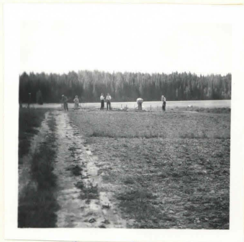
Asp. pohjoisesta . f. 22026