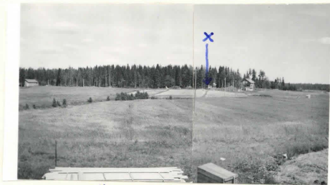
Asp. (x) lännestä .