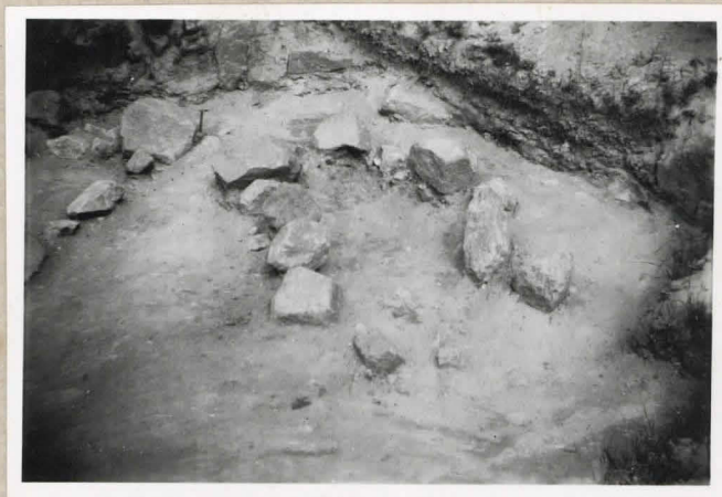
Kuva 2. Samoin kuin kuva 1. Va- hemmassa yläkulmassa hanta II:n itäpää.