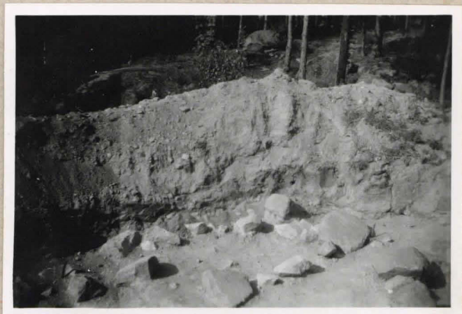
Kuva 3. Hanta II viimeisessä kai- vauvaiheessa. (Varjotettut kivet kartalla.) Lounaasta.