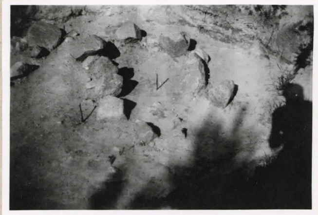
Kuva 1. Hanta I lounaasta lounaasta. Viimeisin kaivausvaihe. (Vah- vasti varjotettut kivet kartalla.)