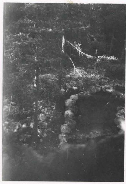
Vehkalahki , Talvaganvuosi . kairalatomus ensin kairauksesta.