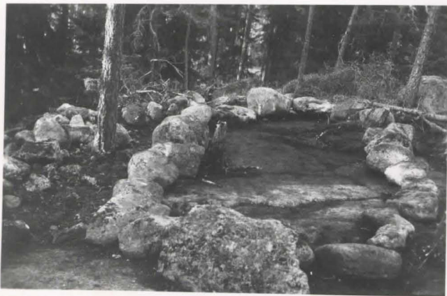
Vehkalahki , Talvaganvuosi . kairalatomus etelästä. Edessä kunnolla perästä kivi.