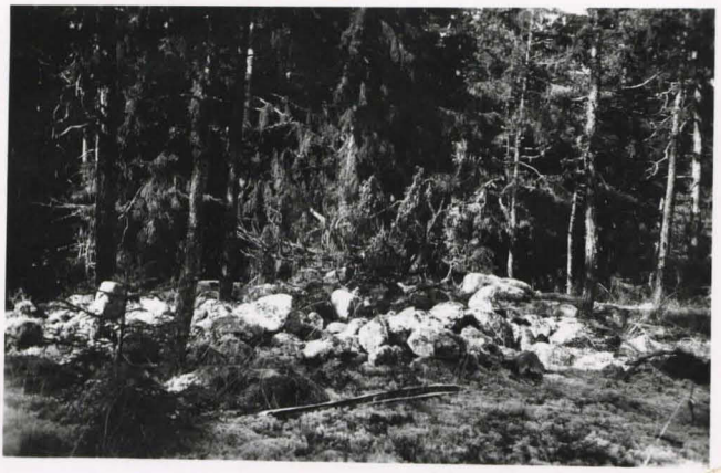
Vehkalahki , Talvaganvuosi . kairalatomus idästä ennen kairauksesta.