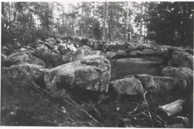
Vehkalahki , Talvaganvuosi . kairalatomuksen kunkalivet kotesta.