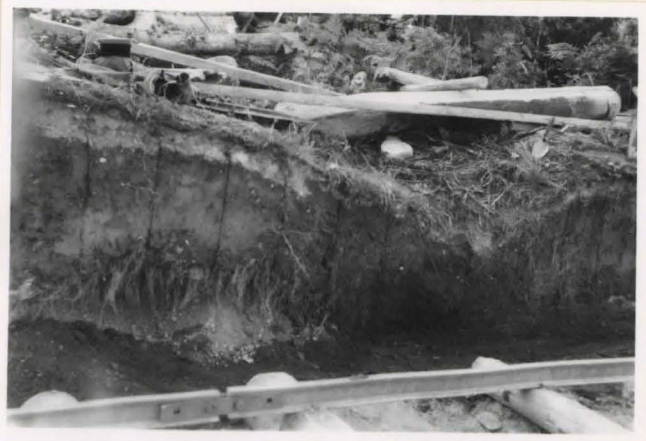
Kyyni , puuri kargyi . Erään "kivittömyksen" profiili. Kairauksesta oikealla olevan kairauksen kohdalla näkyy polyan noli pesäke.