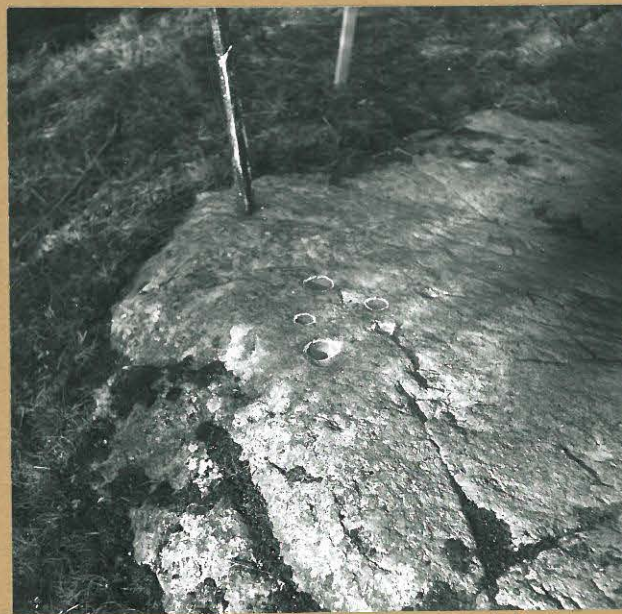
Kuva 2. Kupit kuvattuna pohjoisesta.