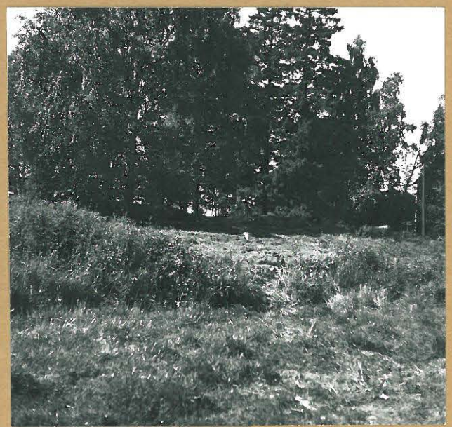
Kuva 6. Näkymä Heikkilän tontin koilliseltä puolelta lounaaseen. Takana oikealla as. Oy Heikkilänkartano. Kuppikallio keskellä kuvaa.