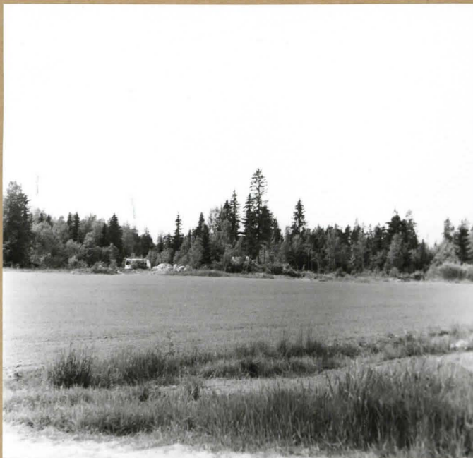
f. 51810 Röykkiö kaakosta.

Värsbergin röykkiö ennen kai- vausta nähtynä etelästä. Kasvil- lisuus on raivattu röykkiön päältä.