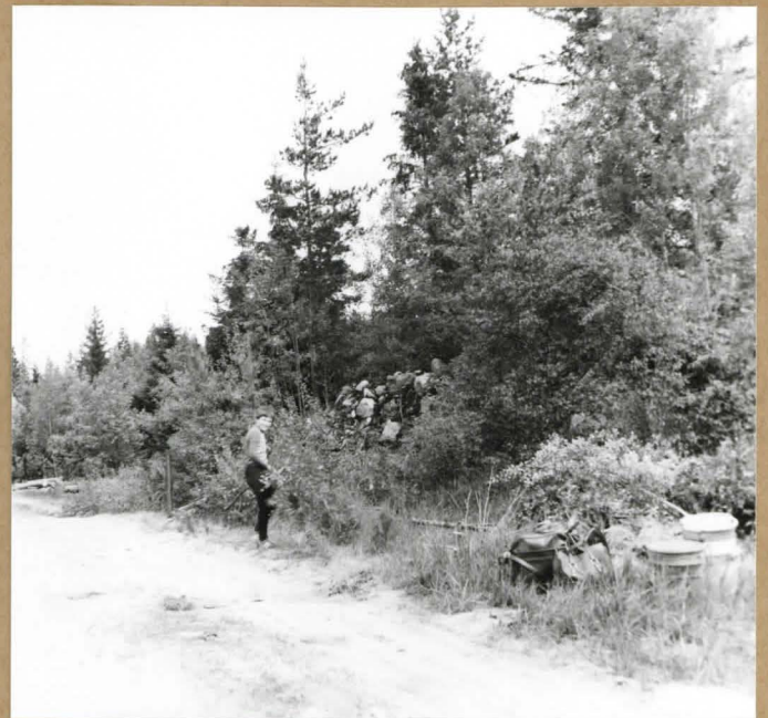
f. 51811 Ennen raivamista. A. JARVAS - 79