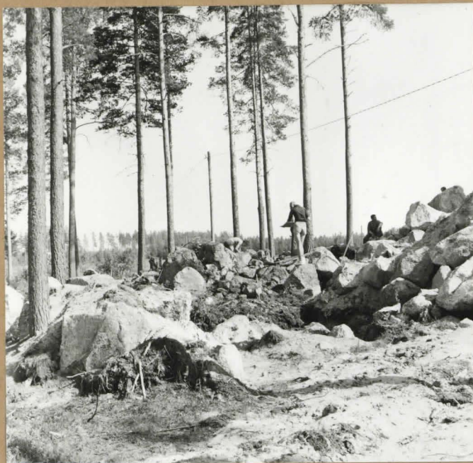
I TASO LUOTEESTA