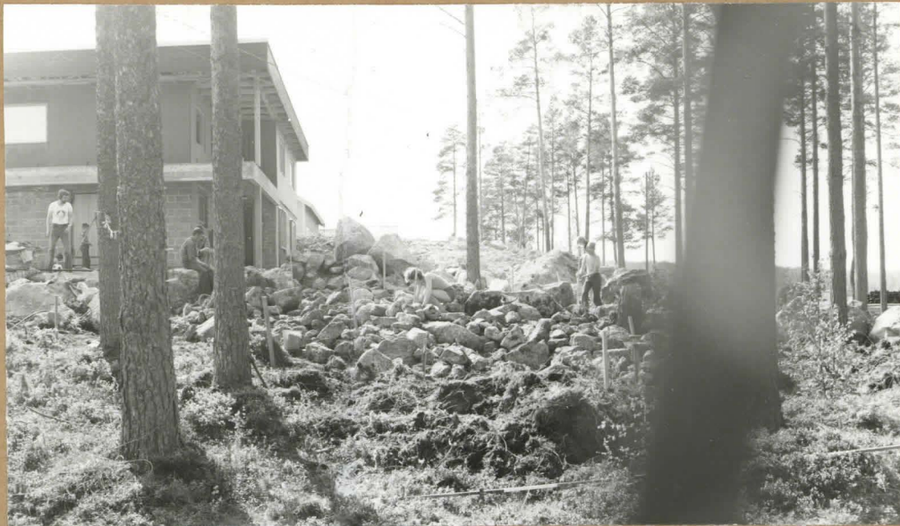
I TASO KOILLISESTA