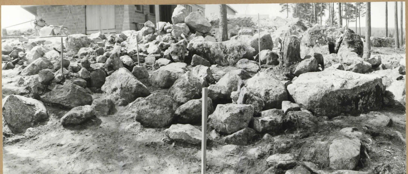
48043, -44, -45