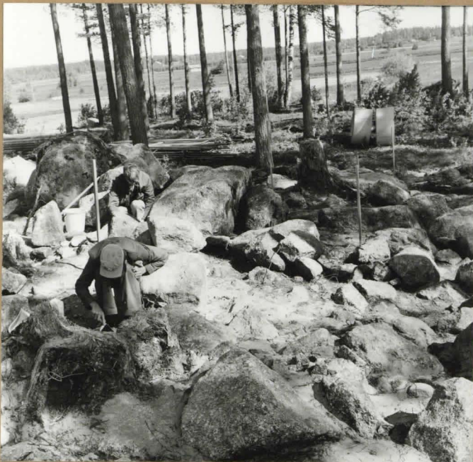
III KERROSTA KAIVETAAN. KUVA IDÄSTÄ