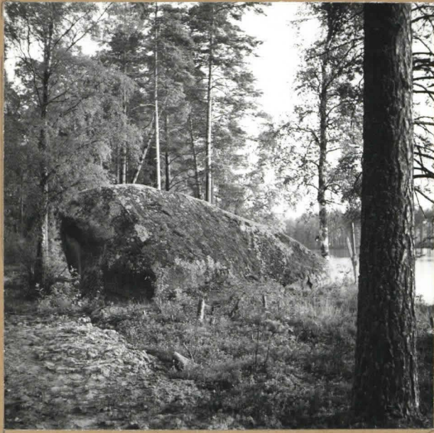
kuva 1. F. 57662