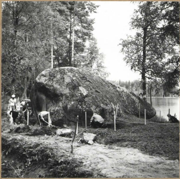
kuva 2. F. 57663