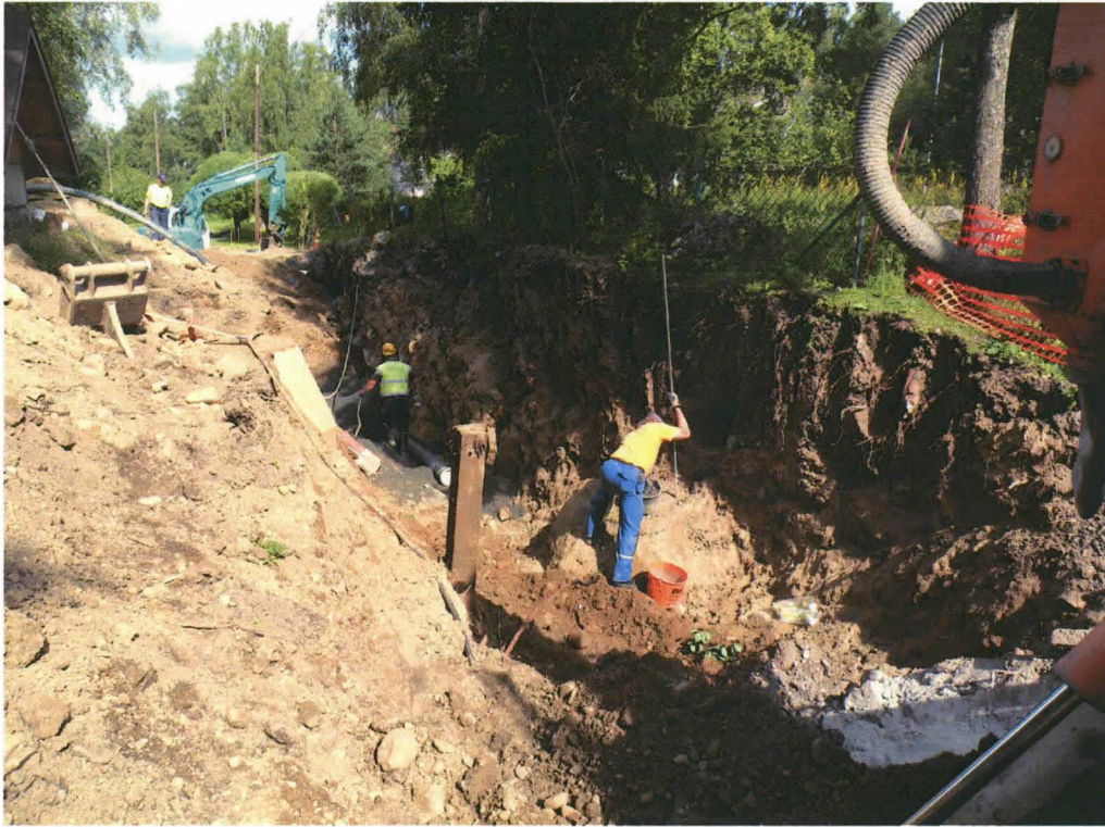
Kuva 3. Hakamäentien työhanke. Valvottua kaivantoa tonttien 6:3 ja 15:2 rajalla. KY 19:8.