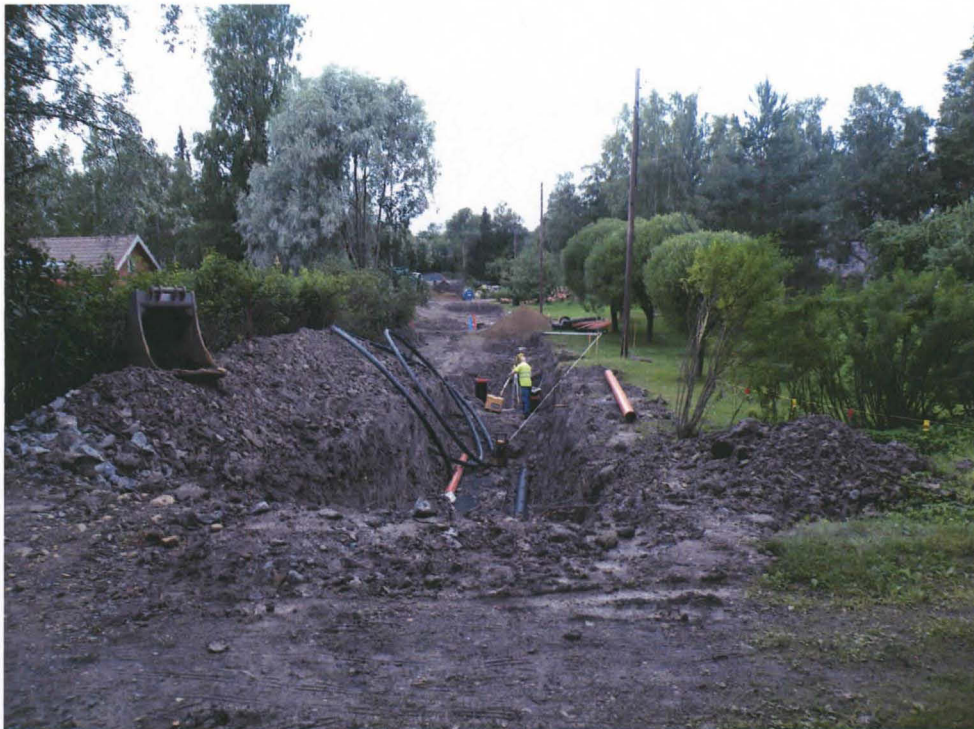
Kuva 2. Hakamäentien työhanke. Ennen arkeologista valvontaa kaivettu alue. Maaperä valvotun kaivualan luoteispuolella oli savinen. KY 19:1.

Hakamäentien valvonnassa kaivettava osuus oli kartassa merkitty niityksi. Hakamäentietä reunustivat viime vuosisadan alkupuolella rakennetut vanhat puutalot ja niihin kuuluvat puutarhat. Kaivettavalla alueella oli ollut vanha käyttämätön tielinja. Valvontatyö aloitettiin Hakamäentie 6:n kohdalta. Tätä aiemmin valvomatta oli kaivettu luoteenpuoleinen tietyöalue. Valvontatyötä jatkettiin Hallamäen tontin puoleiselle työalueelle muutamia metrejä.