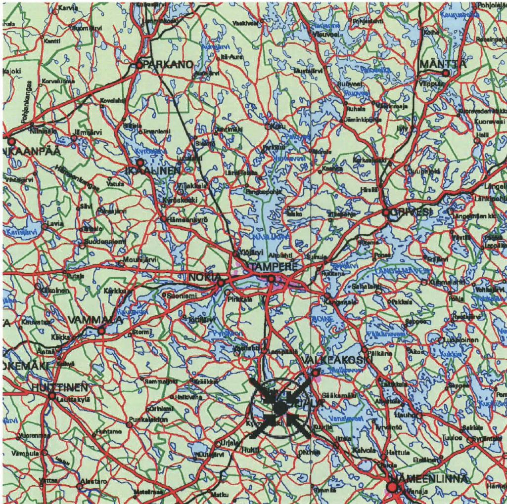
Kartta 1. Valvotun kaivualueen sijainti. Ote maantiekartasta. MK 1:1 000 000.