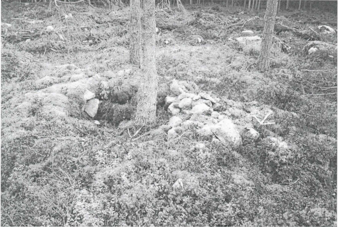
Kohde 8. Eteläisin muinaishauta, jossa kuopanne. Nuoli pohjoiseen.