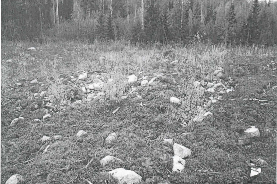
Kohde 5. Muinaishaudan oletettu sijaintikohta. Nuoli pohjoiseen.