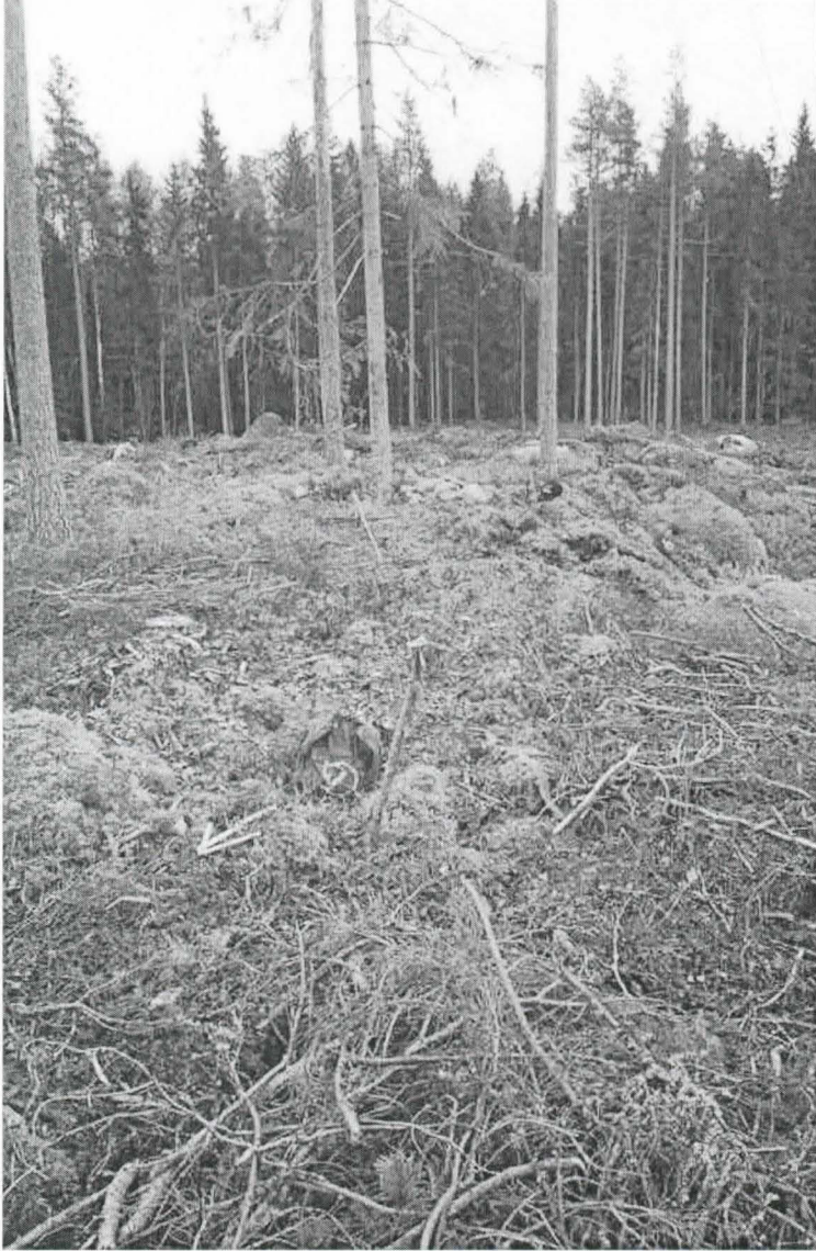
Kohde 8. Pohjoisin muinaishauta repun kohdalla, maakiven viereen tehty lippalakin kohdalla ja eteläisin näkyvä avoin kivikko lakista vasemmalle. Nuoli pohjoiseen.