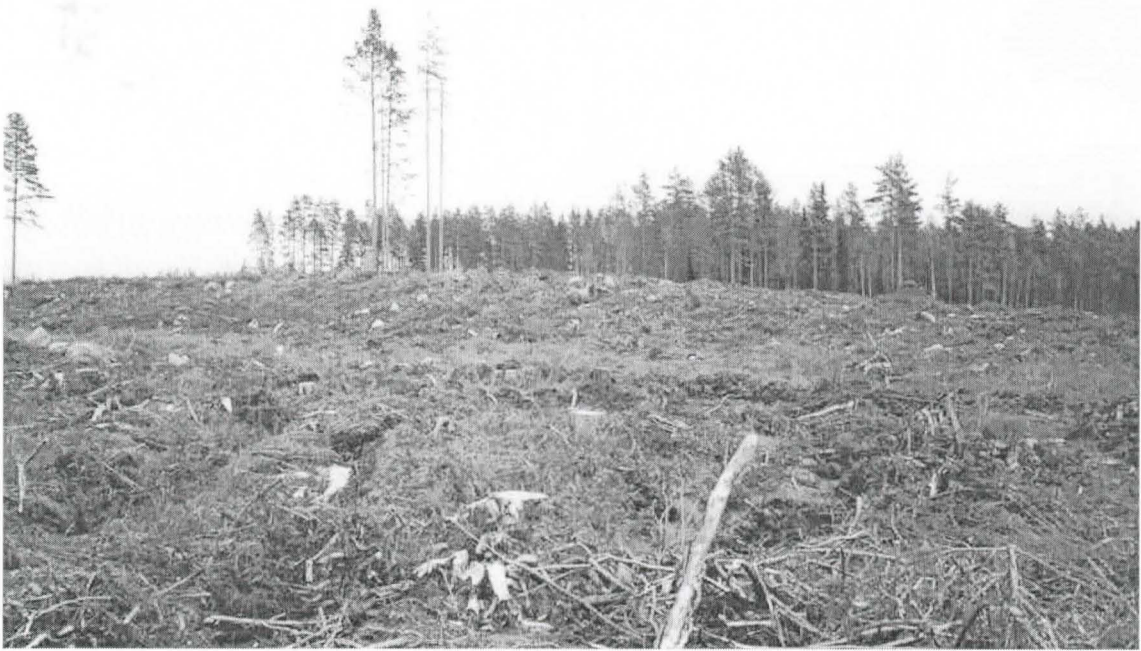
Kohde 8. Muinaishaudat sijaitsivat mäen laella mäntyjen kohdalla. Kuvattu koilliseen.