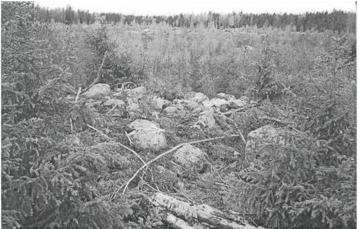
Kohde 3. Muinaishauta kuvan keskellä. Nuoli pohjoiseen.