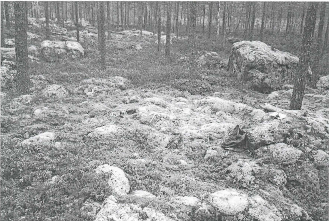
Kohde 7. Muinaishaudan oletettu sijaintikohta. Nuoli pohjoiseen.