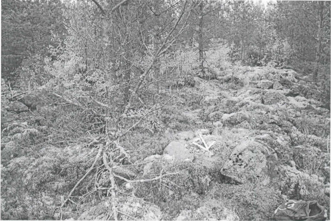
Kohde 1. Asumuksen pohja. Nuoli pohjoiseen.