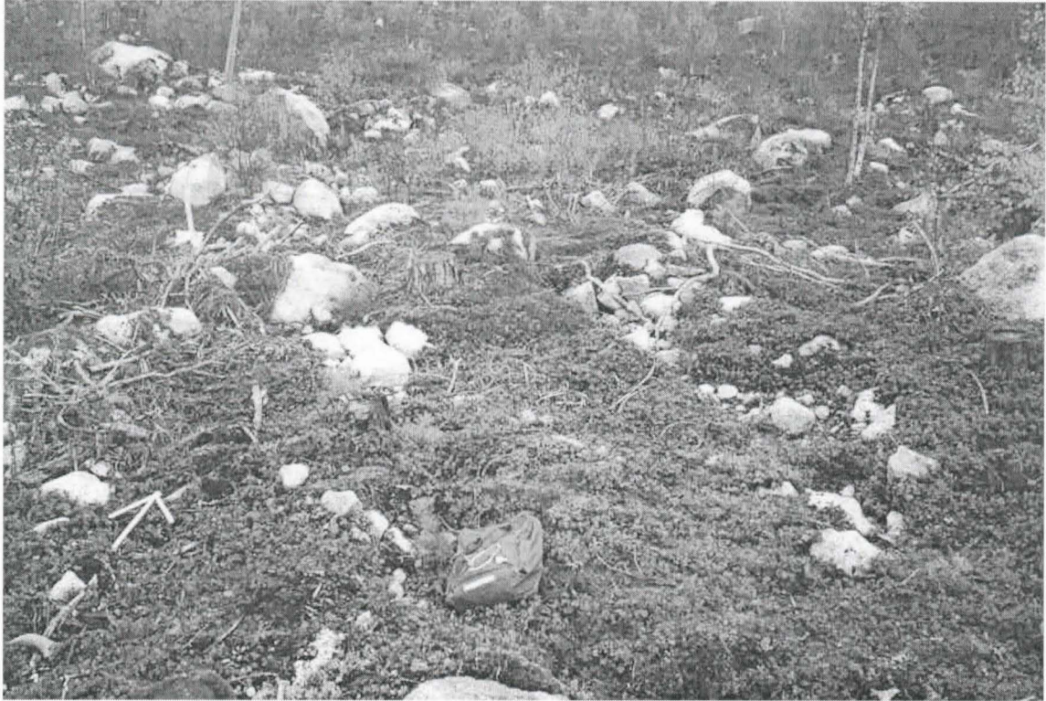
Kohde 4. Muinaishaudan oletettu sijaintikohta. Nuoli pohjoiseen.