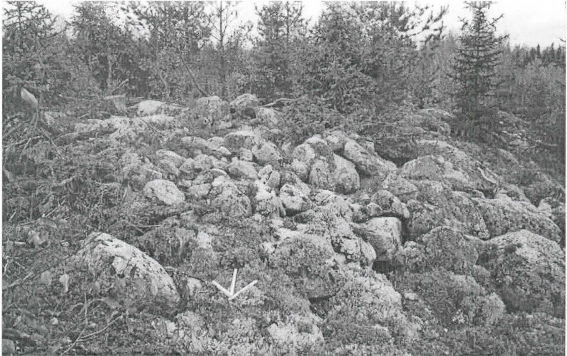
Kohde 3. Muinaishauta luoteisrinteen kivikossa. Nuoli pohjoiseen.