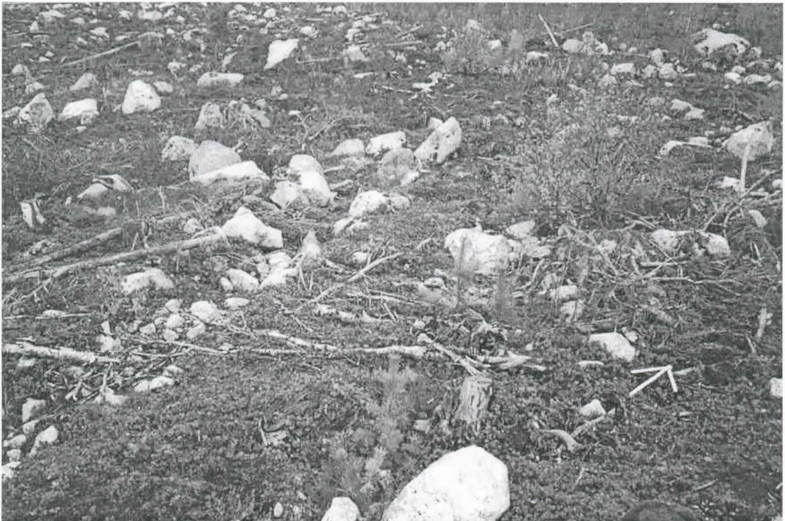
Kohde 4. Muinaishaudan oletettu sijaintikohta. Nuoli pohjoiseen.