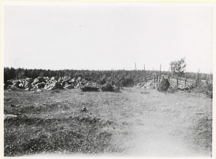
De två minsta kumlena vid Hammarboda. Det ena kumlet befinner sig under järdesgrändens f. m. (Cleve nr 109-110).