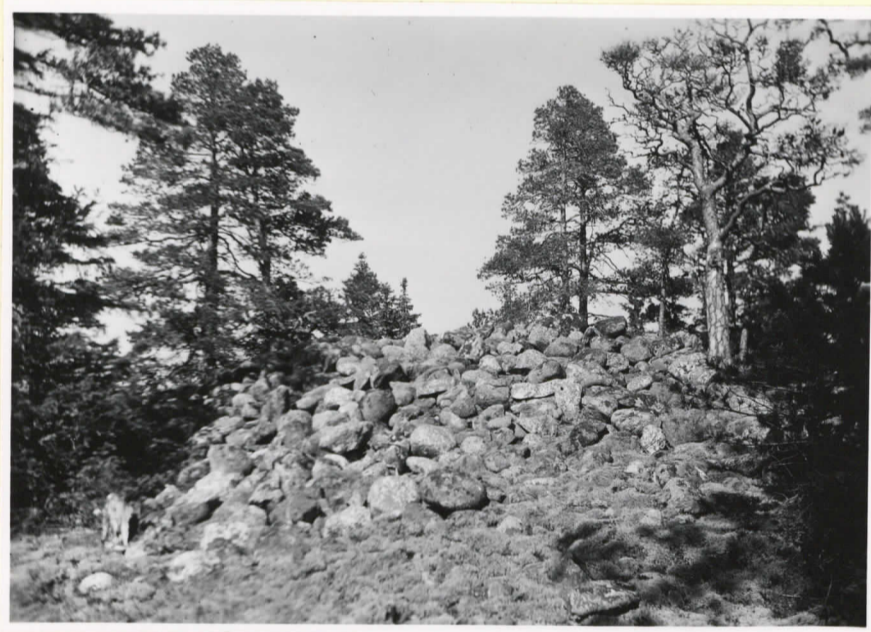
Bronsålderskummul på Stora (se tidigare förtecknad)