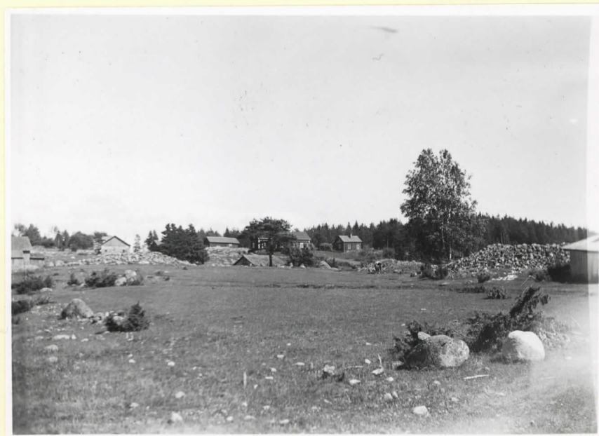
Tre av bronsålderskumlen vid Hammarsboda (Cleve nr 106-108)