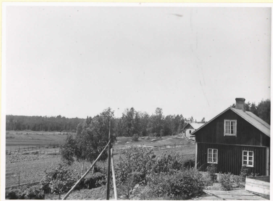
Ansvedja-boplatsens västligaste del invid Södergård. I bakgrunden t.v. det torrlagda träsket.