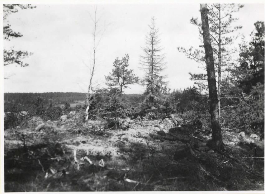
Bronsälderskummet invid vägen ut till Näsudden i Långnäs by. (seu Rindigars föteckning).