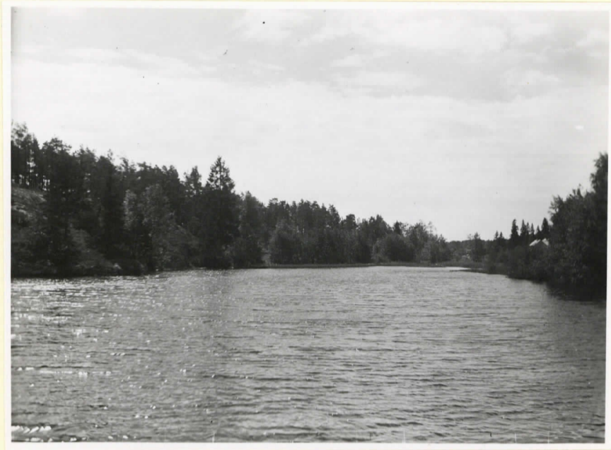
En av de tre små sjöarna, "groparna", mellan Dragsfjärden och Uevet.