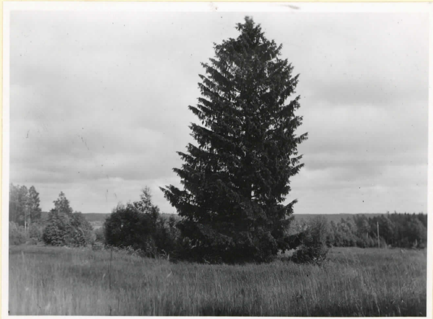
Jordbro-åkern, på vilken finnes tre graskummel, ett av dem under granen.