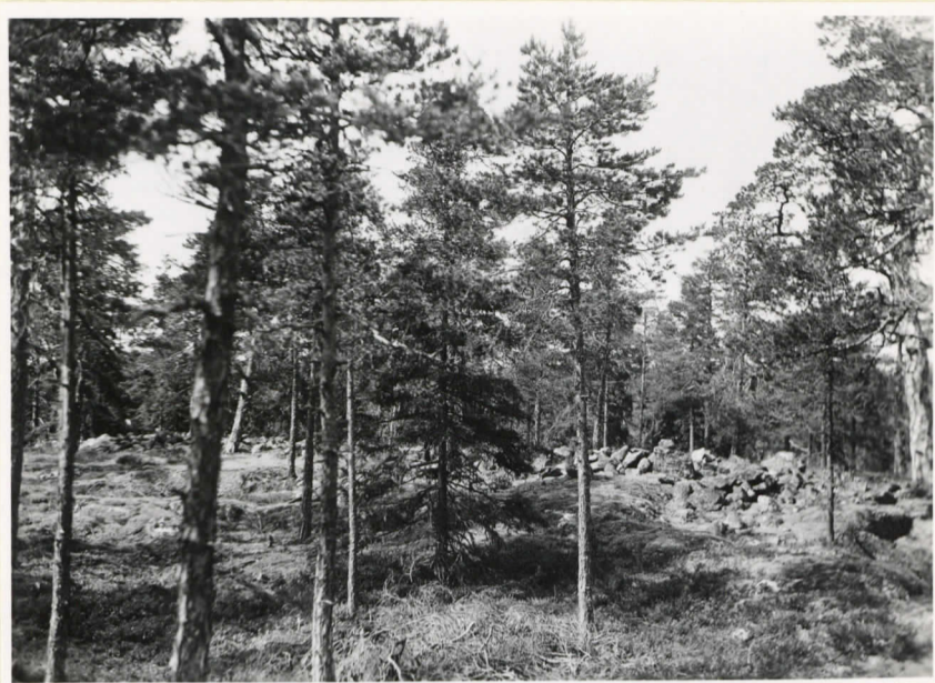
Rektangulärt bronsålderskum- mel på Kosekkullen i Söder- långvike by. (Cleve nr 99)