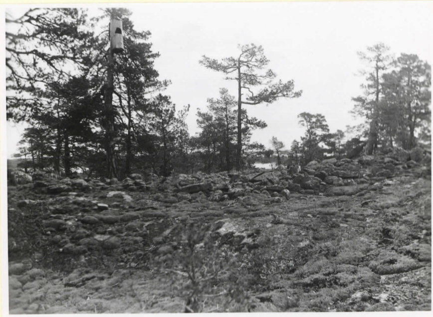
Two källor intill varandra belägna avlånga bronsälderskummet i Rövike by, mittemot Skrumbelu. (Cleve nr 102-103).