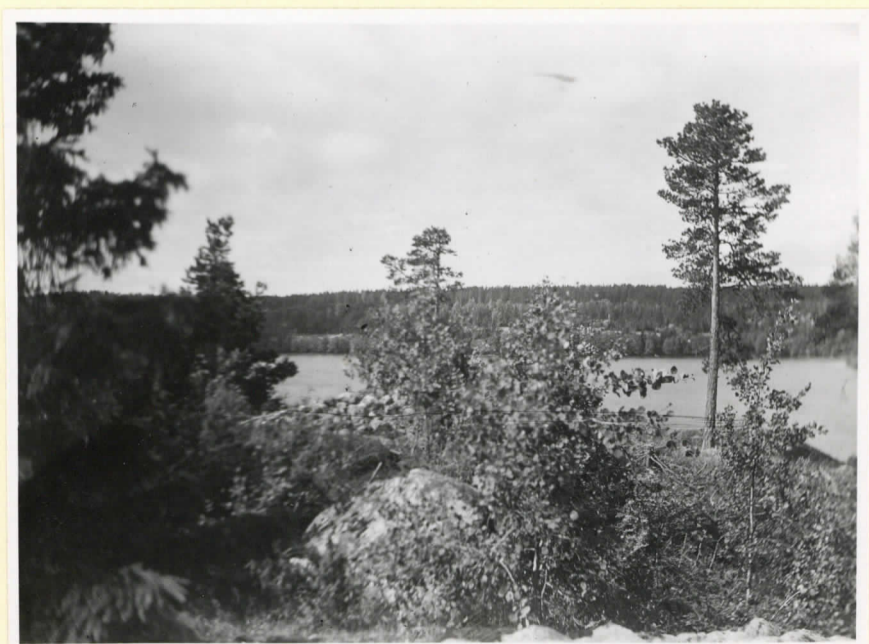
Det mindre kumlet (skymtar mellan buskarna) på Näsudden, sett från det större kumlet.