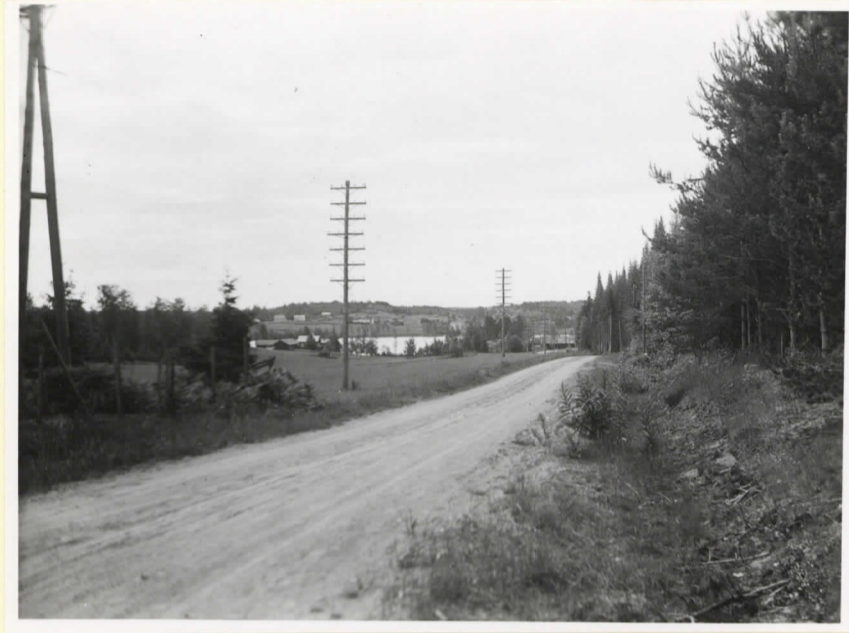
Stenåldersboplatsen på Knipångrs- backen i Söderby. Fyndamrådet är i förgrunden.