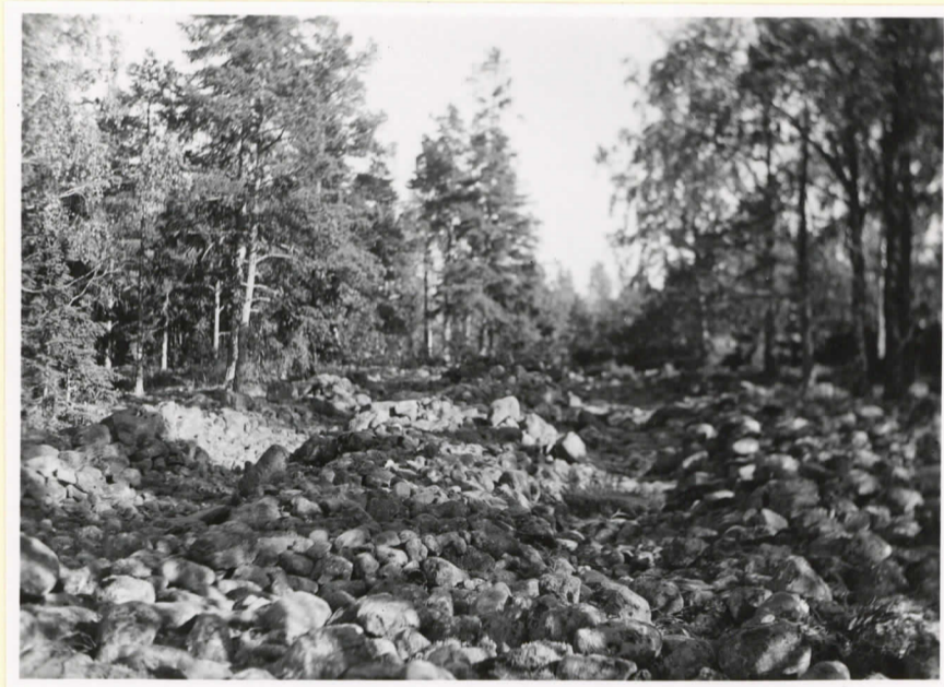
En troligen under modern tid gjord stenvall i en rullstensåker på Skalmisberget i Genbåle.