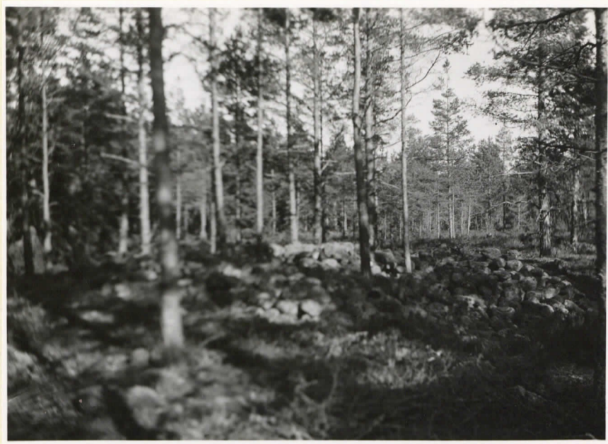
Stenkummet på Västerjällmalmen i ytter-Ölmoss. (Cleve nr III).