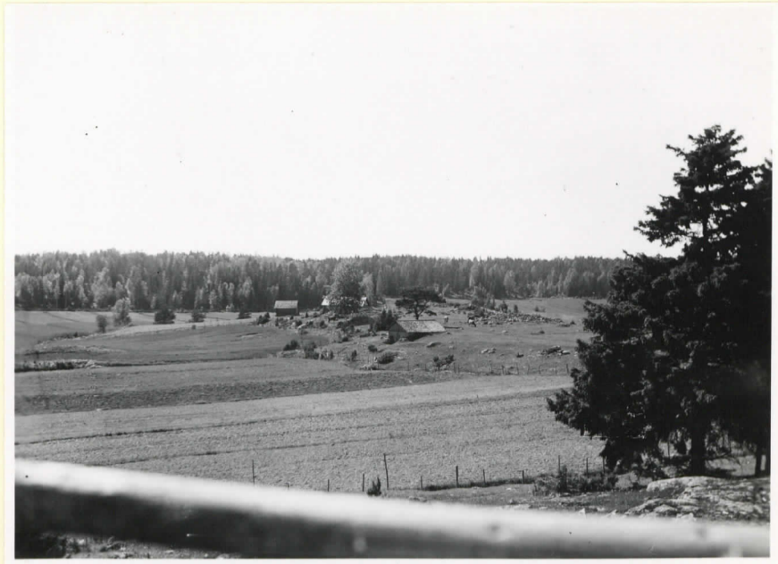
Bronsåldersgravfältet vid Hammars- boda (mitte i bilden) (Cleve nr 106-110)