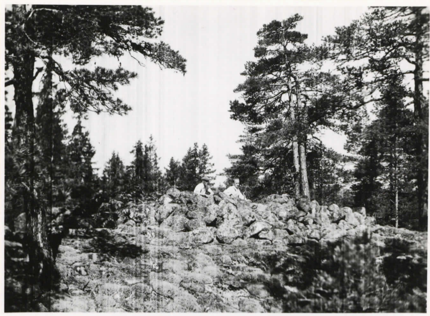
Bronsålderskummul på Åredö. (se tidigare förtecknad)