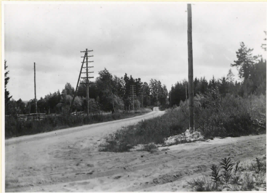
Stenåldersboplatsen på Jordbroalm- nen. Fyndområde på bägge sidor av Landsvägen. I skogsbacken i bakgrunden och på åkern t.v. ett bronsåldersgravfält.