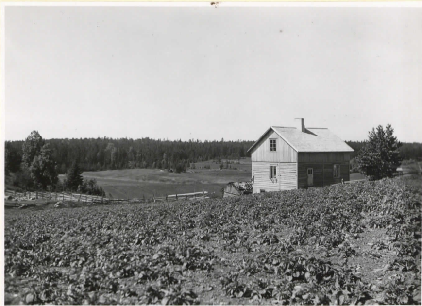
Stenåldersboplatsen vid Ansvedja. I bakgrunden det torrlagda träsket.