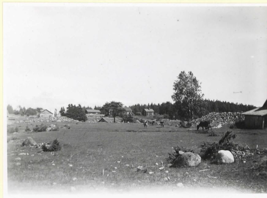
Tre av bronsålderskumlen vid Hammarsboda (Cleve nr 106-108)