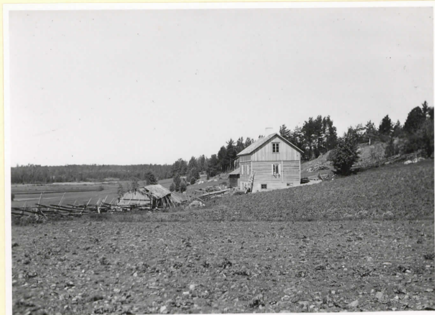
Stenåldersboplatsen vid Ansvedja på gränsen mellan Kråkvik och Hultoböle. Fyndamrådet i älterns förgrunden. I bakgrunden t.v. det utbrakade Ansvedjaträsket.