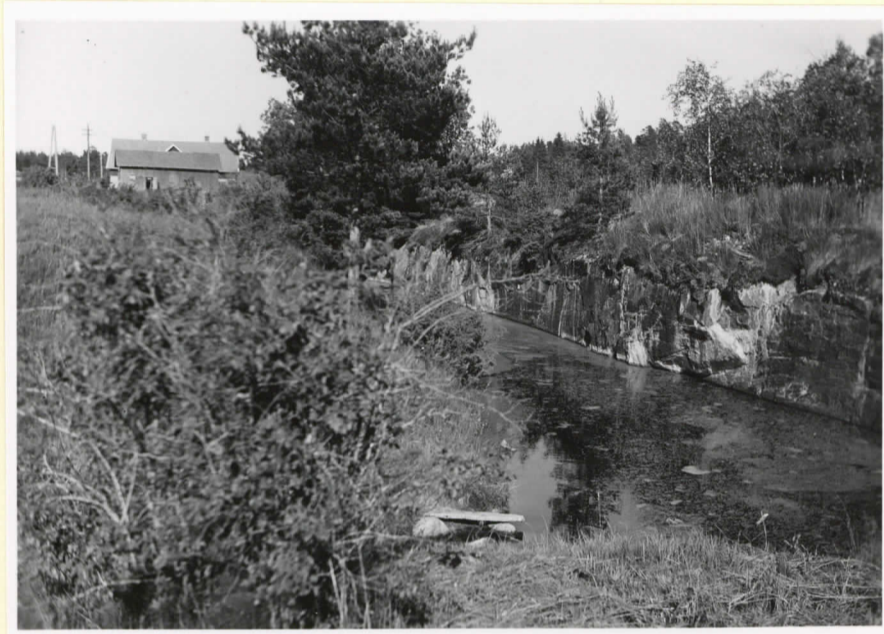
En gammalt kalkstensbrott l.-gruva i Ytterhalla by.