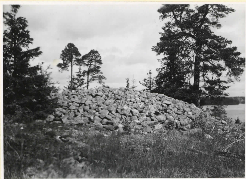
Det större bronsålderskumlet på Näsudden i Långnäs by. (Cleve nr 100)