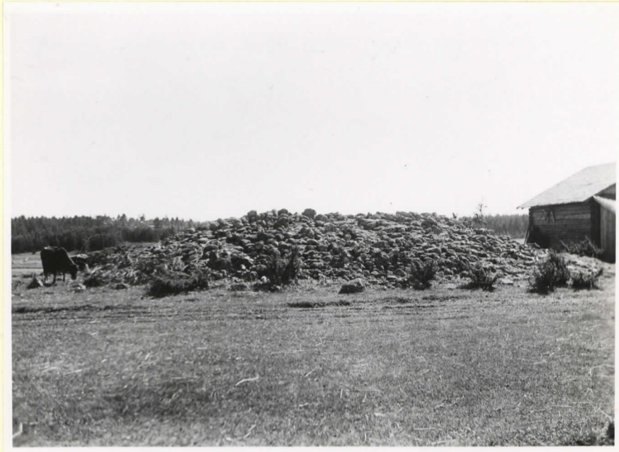
Det största bransädderskumlet vid Hammarboda (Cleve nr 106).