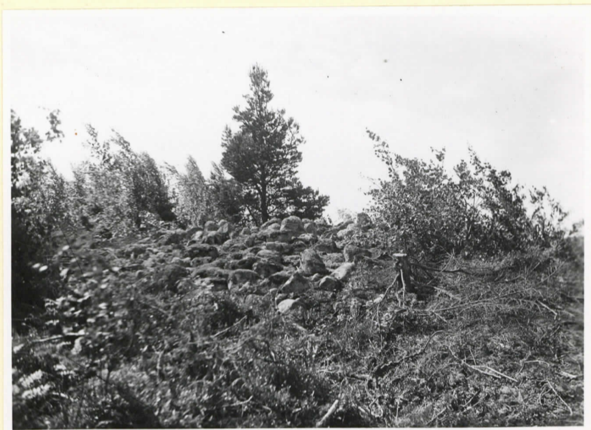
Det mindre kumlet på Näsudden. (Cleve nr 101)