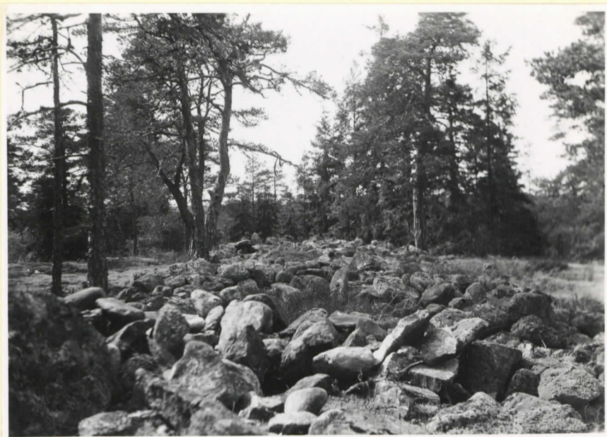
Det rektangulära kumlet på Kosekkullen i Söderlångvike. Bilden tagen i gravens längdrikt- ning. (Cleve nr 99)