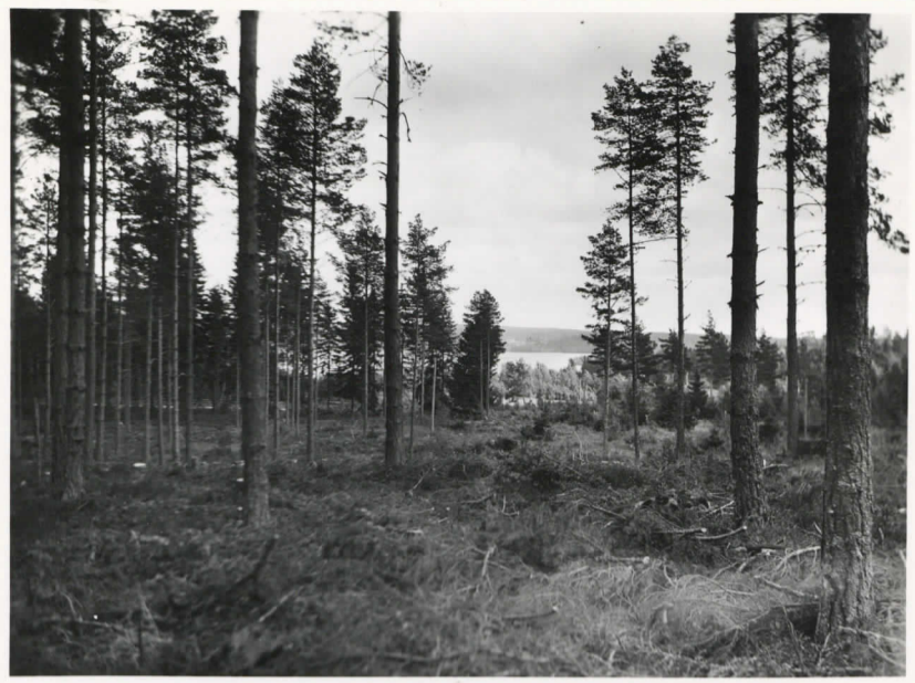
Situationsbild över stenålders- boplatsen på Jordbroalmnen. I bakgrunden Dragsfjärden.