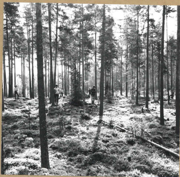
Kuten edellinen kuva, mutta jokaisen röykkiön päällä seisoo poika. Näkyvissä kuusi röykkiötä, kuvattu seitsemännen päältä.