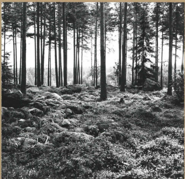
Edellisen kuvan röykkiö on kuvassa vasemmalla. Taustalla ison kiven luona on yksi röykkiö. Huomaa, että maasto on kauttaaltaan melko kivistä.