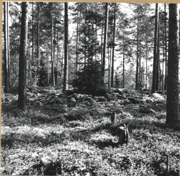
Mäen keskellä oleva laaja-alainen röykkiö. Kuvattu lännestä.