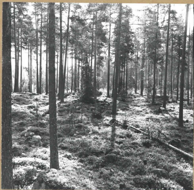
Korkeamäen röykkiöalue kuvattuna mäen korkeimman kiven päältä kaakkoon.

ALAHÄRMÄ Korkeamäki Matti Bergström 1984