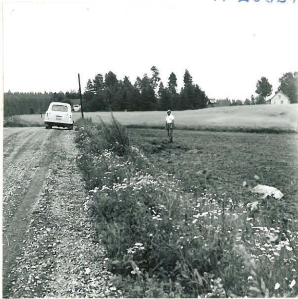
1. Ennen K.M. 15860:1-2 työ- työpaikka Asikkalan Salonsaa- ren Laukkolan tilan (1 4 ) maala- lla. Kuva on otettu länsiluoteesta. Laukkolan isäntä seisoo työ- työpaikalla.