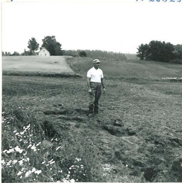
2. Sama työpaikka kuvattu tänä länsiluoteesta. Taustalla näkyvät pelloraunioita. Vasen- malla Mäijänmäki.