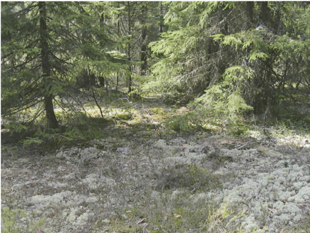
Lähikuva jatulintarha A:sta