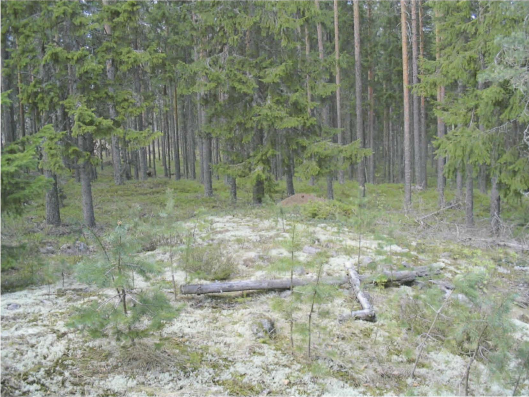
Yleiskuva, jatulintarha B, kuvattu kaakosta