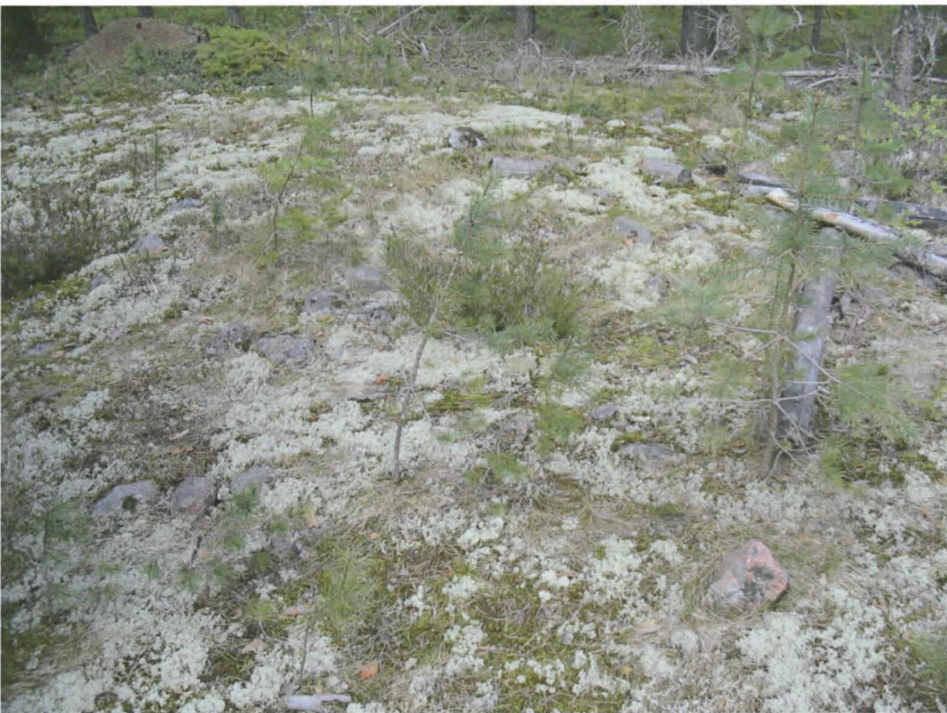
Jatulintarha B, hajonneita kivikehiä