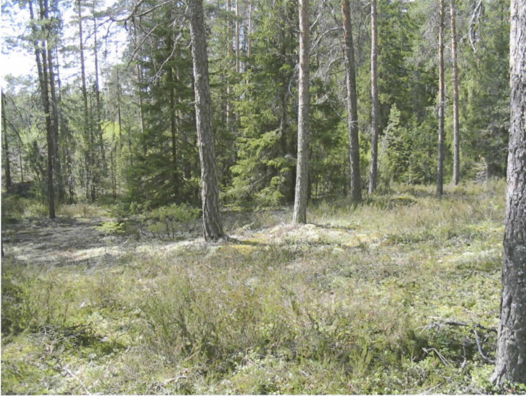
Yleiskuva; Jatulintarha A, kuvattu kaakosta.