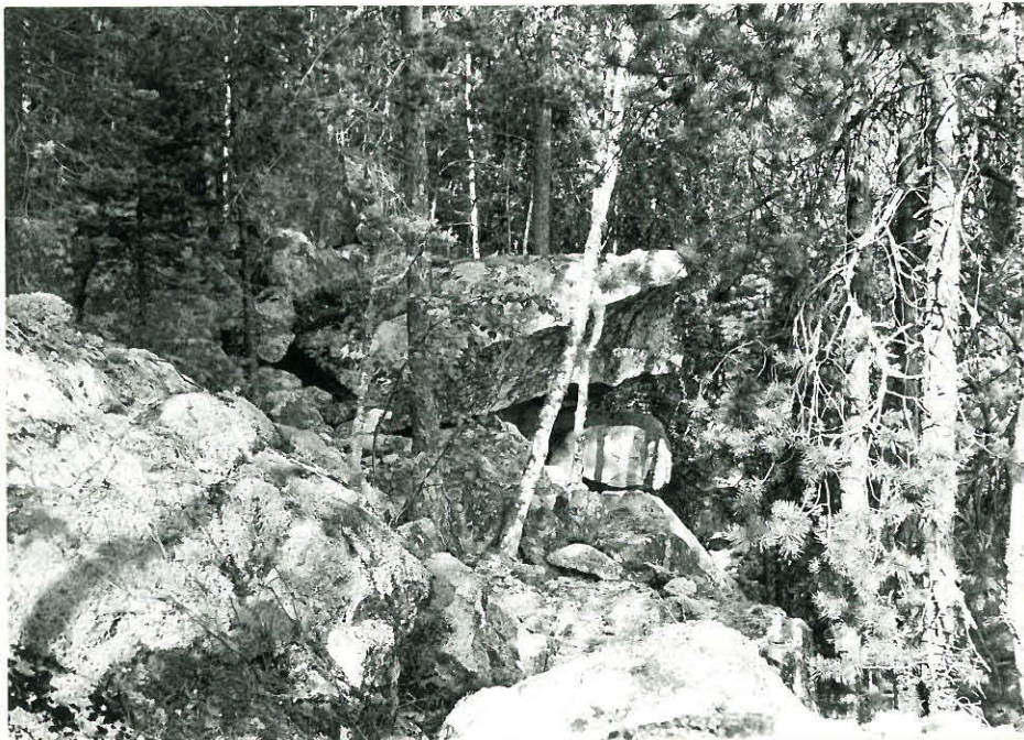
Maalaus on kuvassa näkyvän pään katossa.