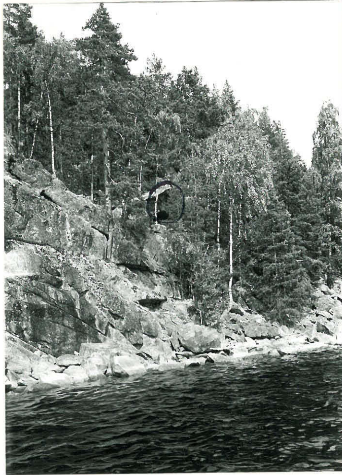
Meishuva Kurtinniemen rinteestä.