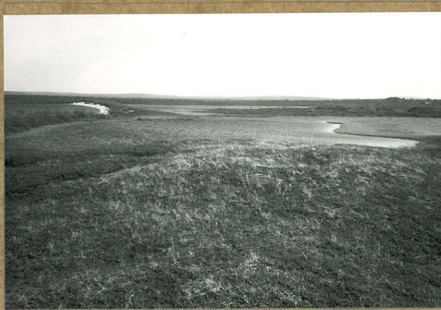
81885. Itäisin pyyntikuoppa lännestä.