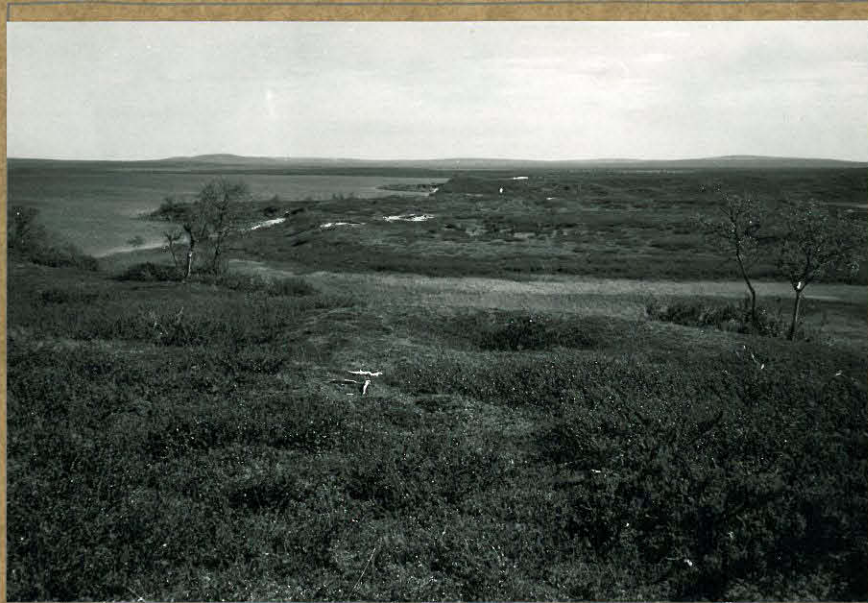
81883. Pyyntikuoppa ENONTEKIÖ NAAPAMELLA E 2 lännessä, taustalla kivikautinen löytöpaikka ENONTEKIÖ NAAPAMELLA E 1.