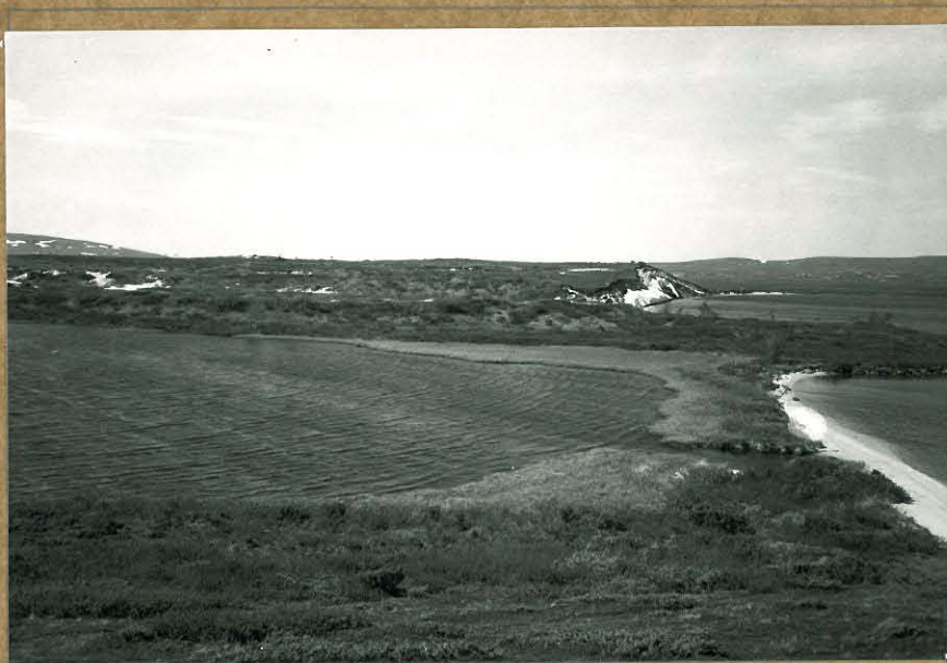
81884. ENONTEKIÖ NAAPAMELLA E 1 (keskellä vasem- malla) idästä, taustalla Naapamella.