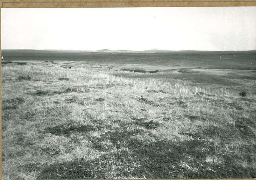
81886. Lapinkenttä etelästä.