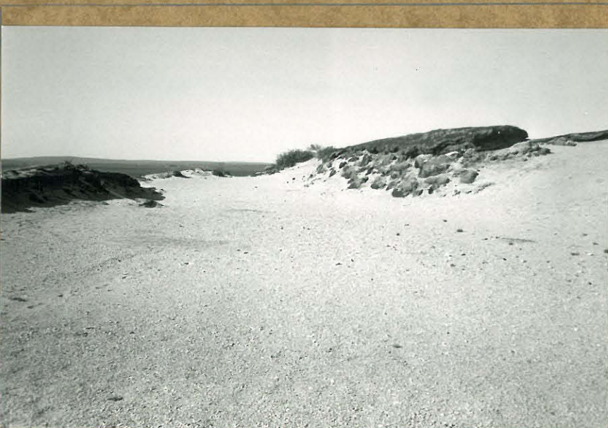
81888. Löytöalue lounaasta.