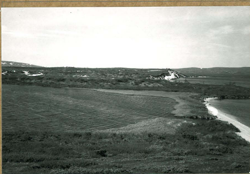
81884. ENONTEKIÖ NAAPAMELLA E 1 (keskellä vasem- malla) idästä, taustalla Naapamella.