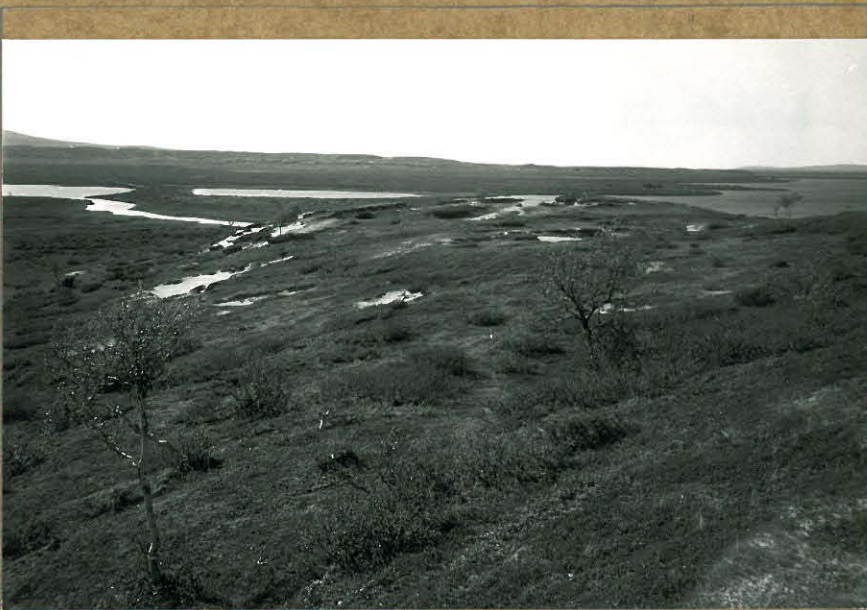
81890. Yleiskuva kaakosta.