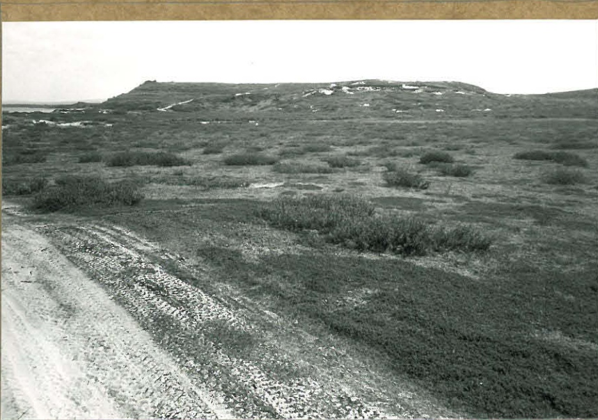
81891. Yleiskuva lännestä.