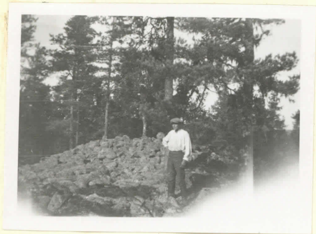
Kummel Ingå, Finnviken (röse n:o 16). (plåt 7342).