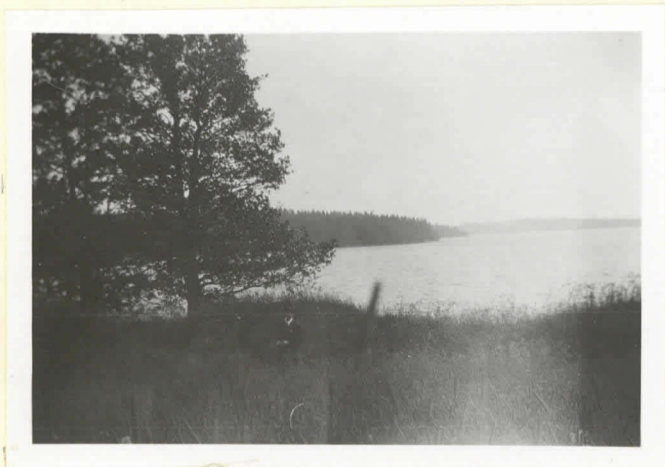
Batterier vid Battubacka, Barkarsund (ca. 1788-89). (plåt 7346).