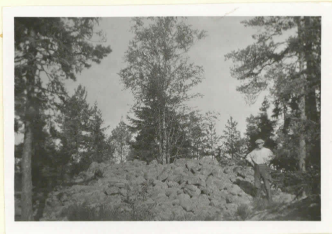
Kummel Ingå, Finnviken (röse n:o 17). (plåt 7343).