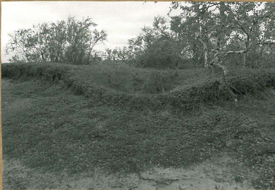
F 74837 PYYNTIKUOPPA-ALUEEN KESKIOSAA, KUVAATTU LÄNNESTÄ