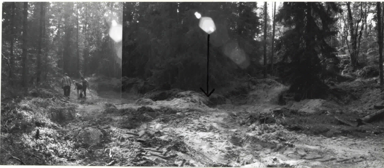
F. 124652-53 Panoraamakuvaa työpaikasta kuvattu koillisesta työkohta merkitty nuolella