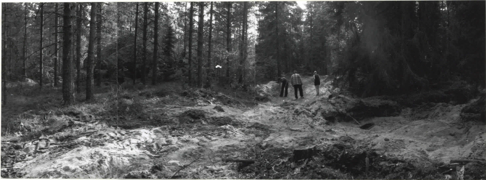
F. 124654-56 Panoraamakuvaa saviastioiden työpaikalle kuvattu koillisesta