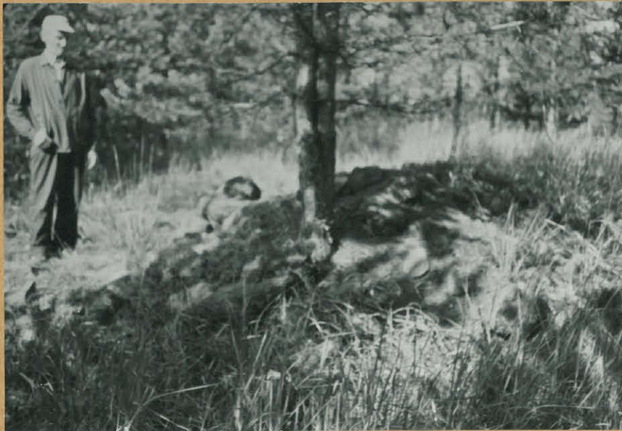
Repro, F. 50321