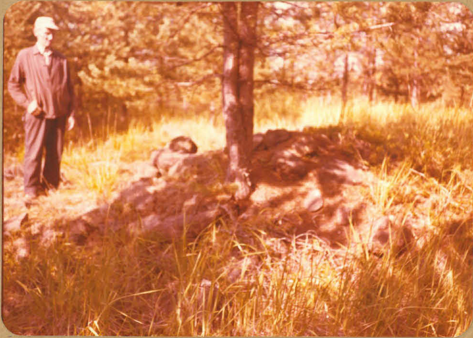
Alkuperäiskuva, kuvannut Valter Lyysaari

koordinaatit noin x=676100 y=55822 z=45 (peruskartta 1133 06)