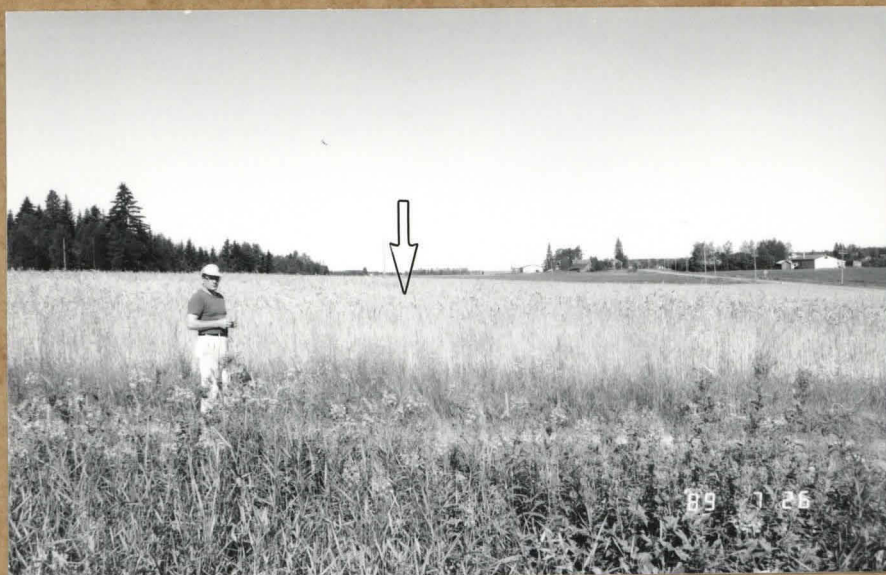
79756. TALTAN (KM 24832:1) LÖYTÖPAIKKA 10 M PELLONREUNASTA. VASEMMALLA LÖYTÄJÄ MV. AHTI KORPI. ETELÄSTÄ.