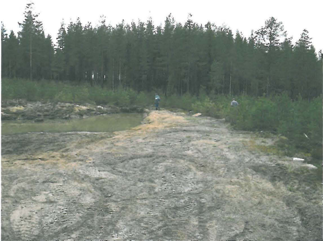
Kuva 5. Uusi löytöpaikka, Oosinkangas 3, sijaitsee Oosinkangas 1:stä noin 500 metriä luoteeseen.