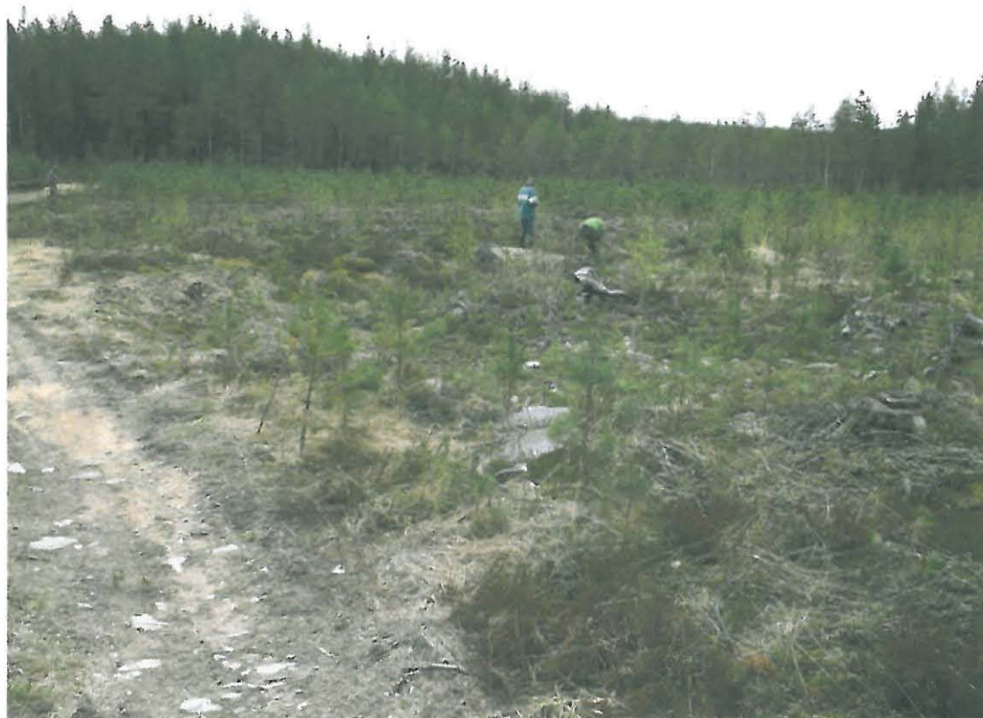
Kuva 6. Oosinkangas 3. Löytöjä tuli sekä äestetyltä alueelta että nuoresta taimikosta.