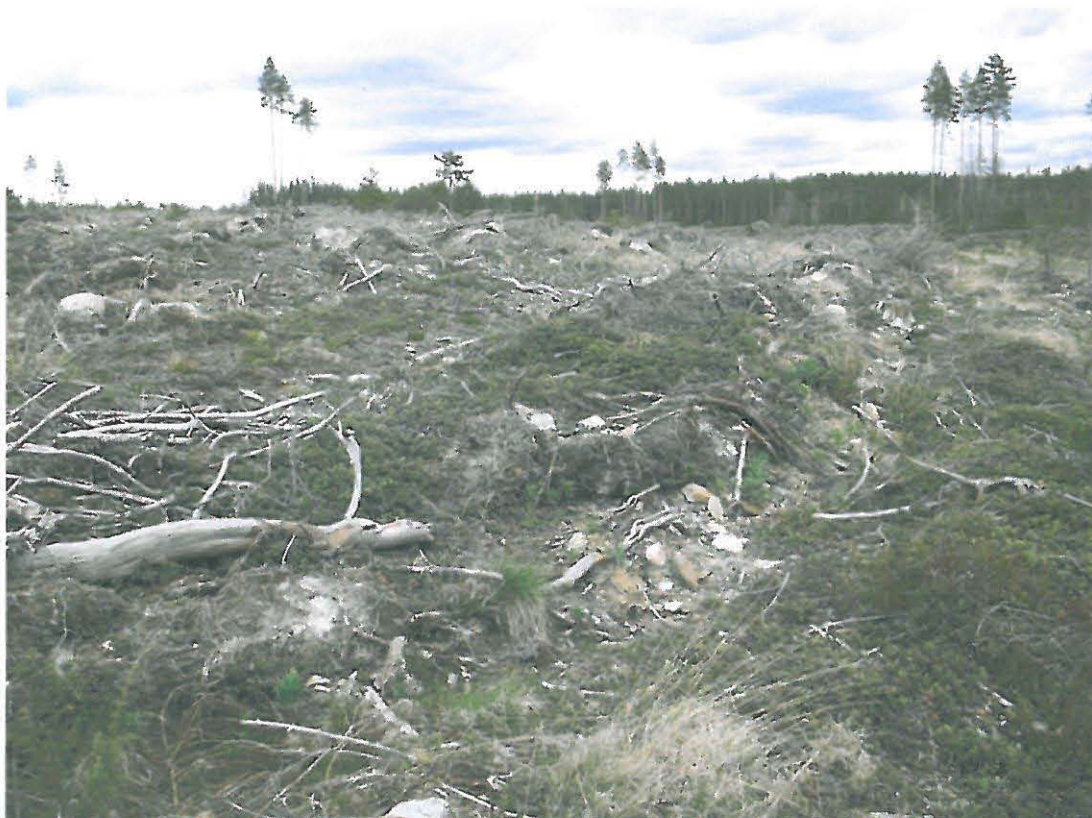
Kuva 2. Löytöalue oli heti metsäautotien varressa, varsin suppealla alueella.