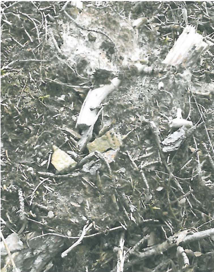
Kuva 4. Saviastianpaloja muokatussa maassa.