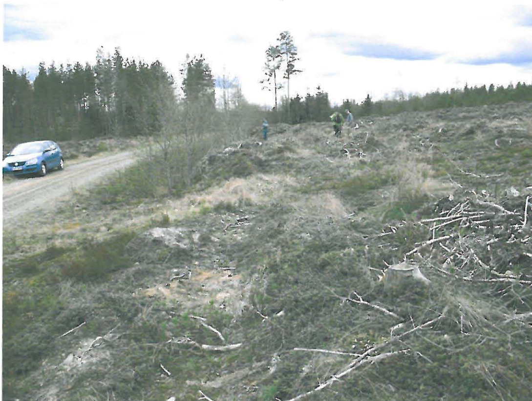
Kuva 1. Oosinkangas 1, kivitautista asuinpaikka-alue. Löytöjä tuli eniten kohdasta, jossa sinipukuinen mies seisoo yksinään. Tarkastuksessa löydetyt keramiikan palat tulivat tien toiselta puolelta, sinisen auton takaa.