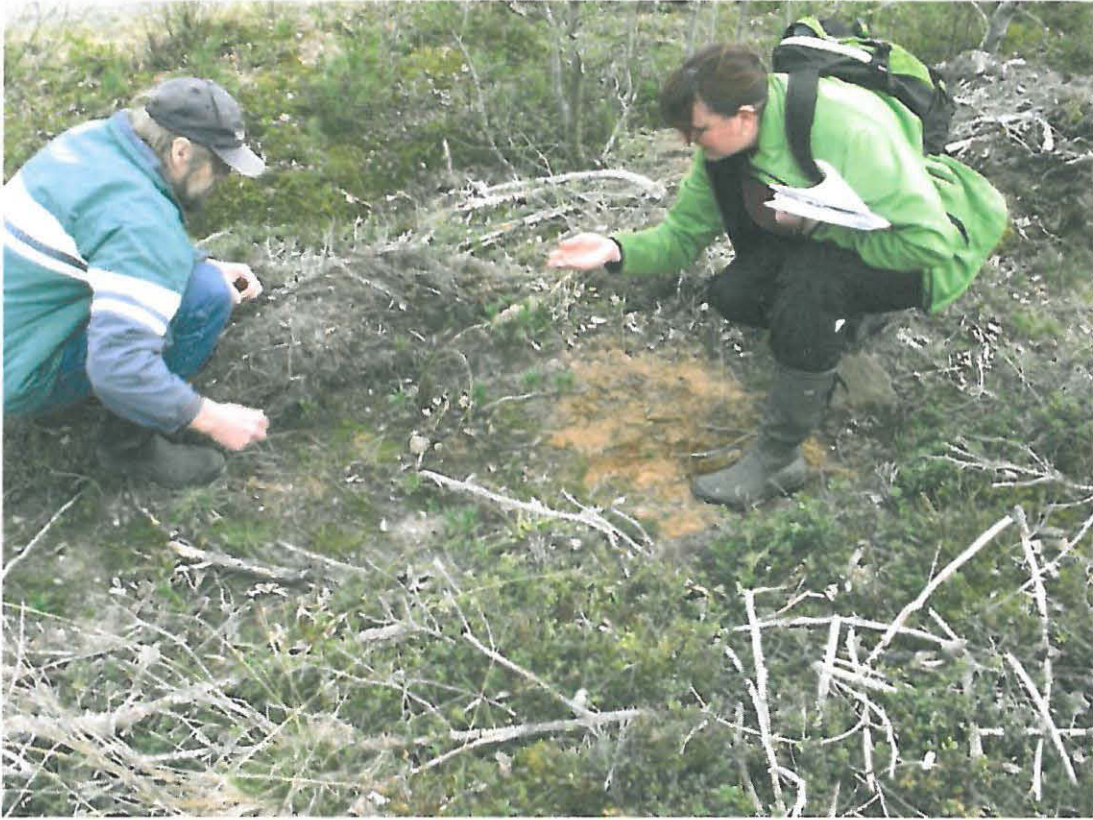
Kuva 3. Palanutta luuta löytyi selvänä keskittymänä.