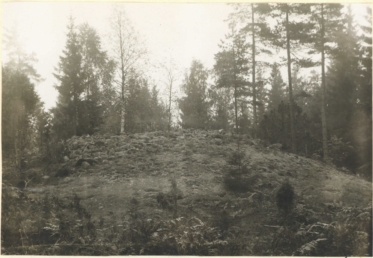
Kuv. 1 Hautausmaus Övre Töllsin haassa 6430. ("Kohagen") lännestä päin. N:o. 21.9. 1926