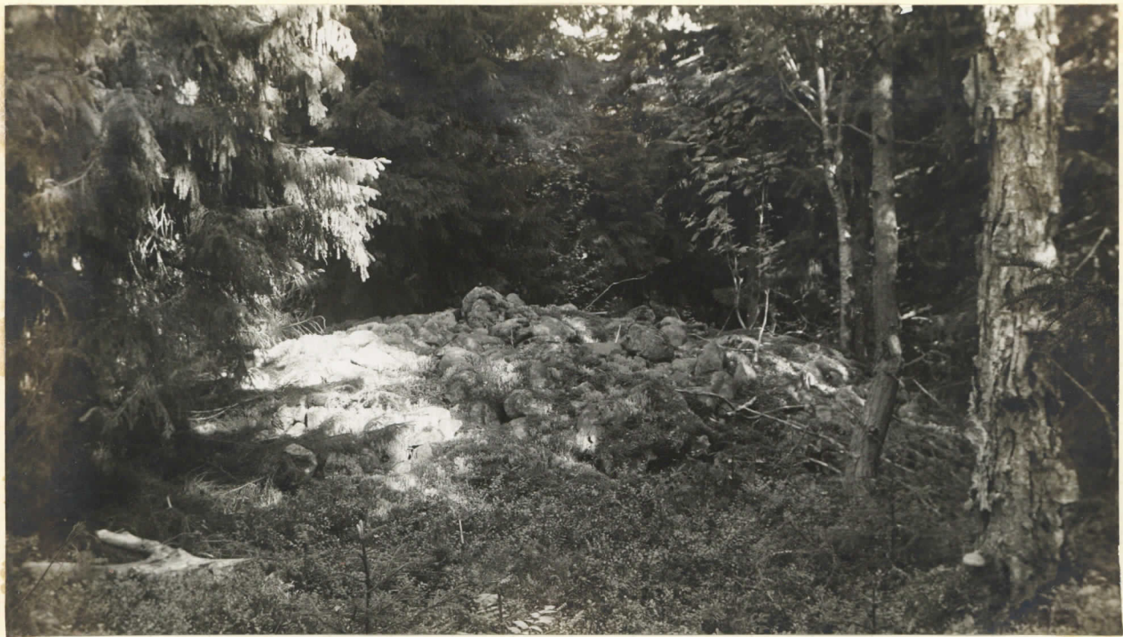
Kuv. 5. Hautaraunio Grönäsudden kalliol- la Sarvikiin kartanon loma, paljoisesta päin. Valokuvattu Alvingon luteun jälkeen 18. 9. 1926.