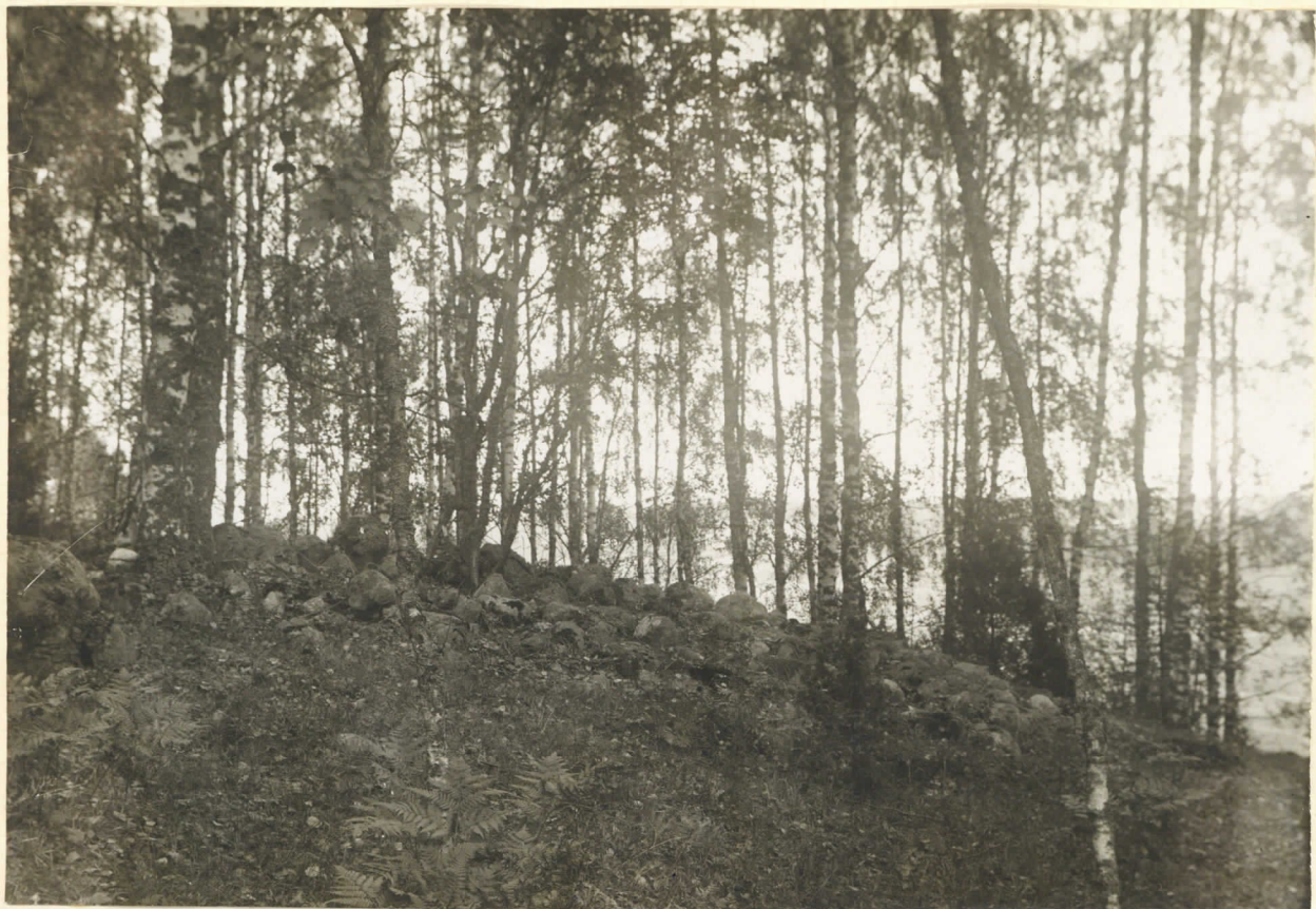
Kuv. 2 Hautausmaus Ingvaldstbyn Nägelsin Falon haassa ("Härthagen") lännestä päin. N:o. 21.9.-26.