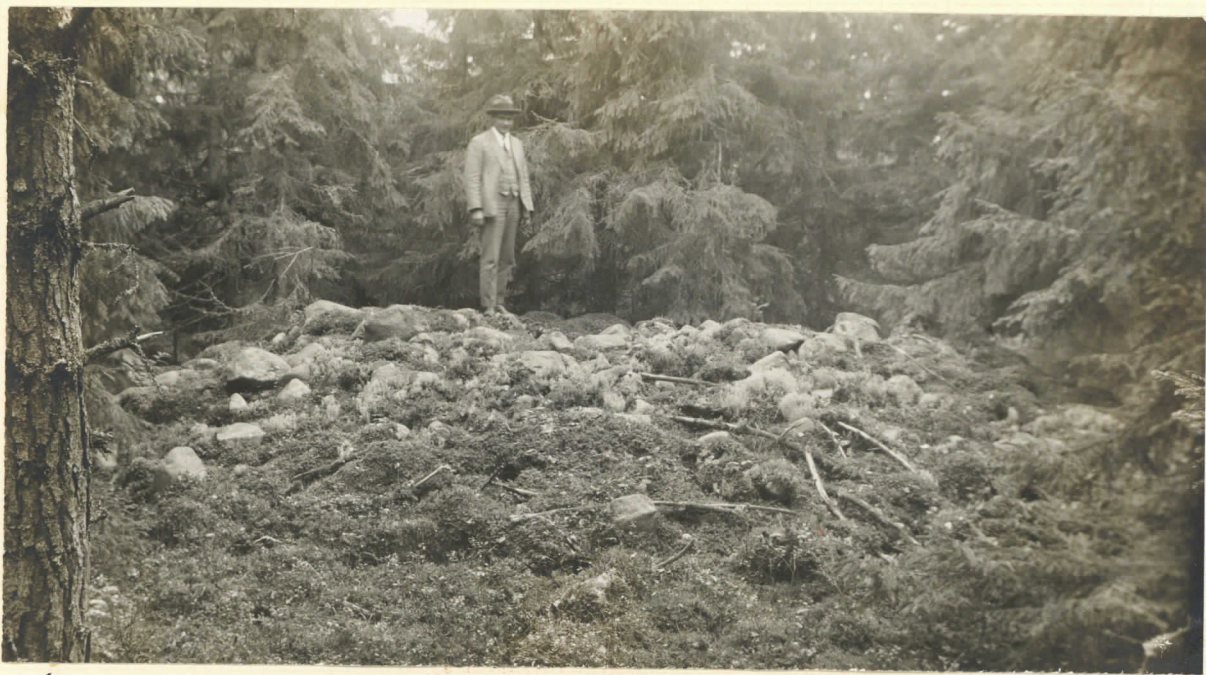
Kuva 7 Eteläinen rauniokautaraunio 6436. mäki Porkkalan Rövans Övergårdin metsä- sä yläpuolella joulukuun 19. päivä. Nr. 19.9.1926.