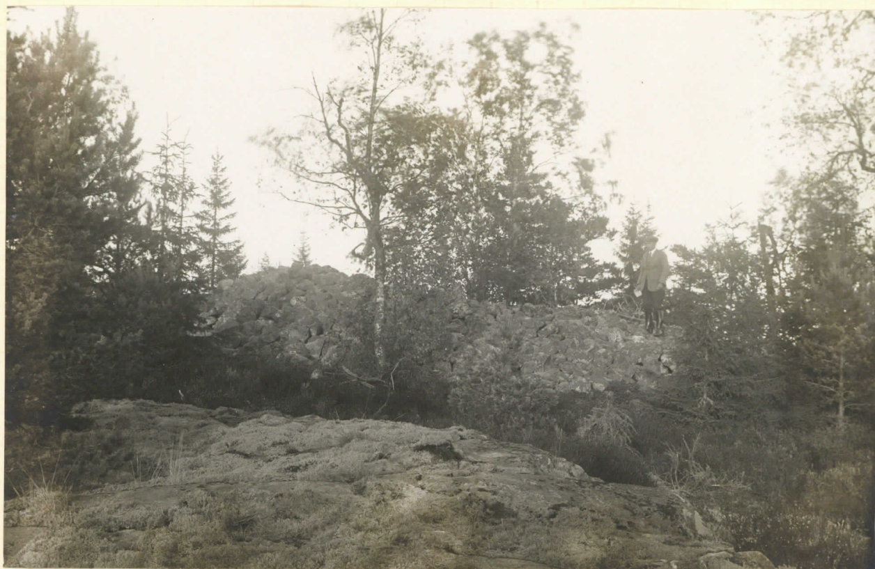
Kuva 8. Iso hautaraunio korkealla vuorella 6437. Grundvikängens eteläpuolella Rövans Neder- gårdin maalla Porkkalan kylässä. Nr. 19.9.1926. Valokuva otettu lounasta päin.