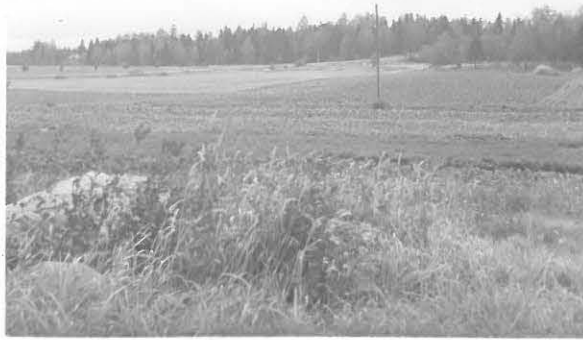
Toinen hautakumpu. 30386