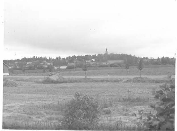
Hattulan uusi kirkko 30388 kuvattu uhrikiveltä.