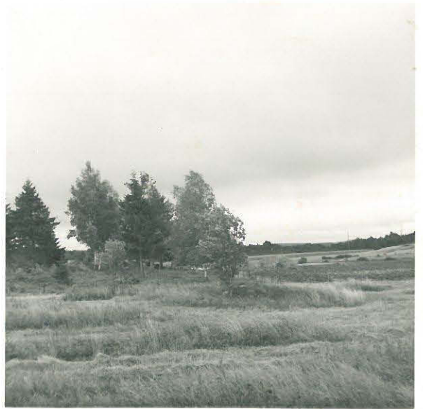
Toinen hautakumpu ensimmäisen koivun vie- ressä. Kuvattu uhrikiveltä.