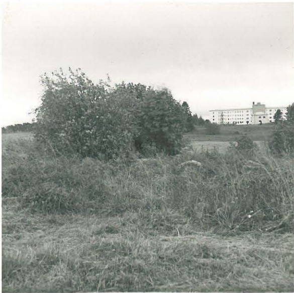
Hautakumpu, jossa uhrikivi. Taustalla B-mielisairaala.