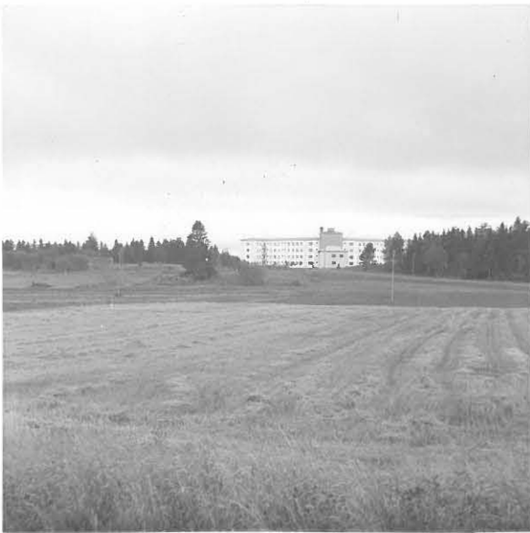
Sairaala uhrikiveltä 30387 käsini.