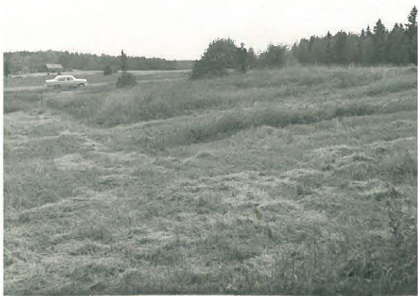
Sairaalan talouden- hoitaja seisoo uhrikiven vieressä. Kuvattu sairaalasta käsini.