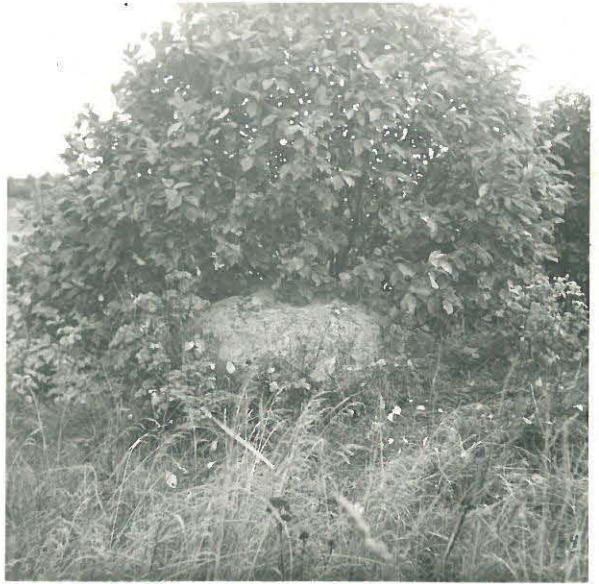
Uhrikivi samassa kummussa. 30383