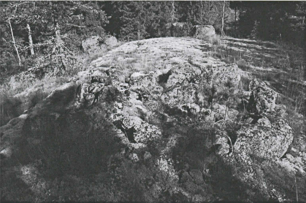
DG681:2. Kivirakenne. Idästä.