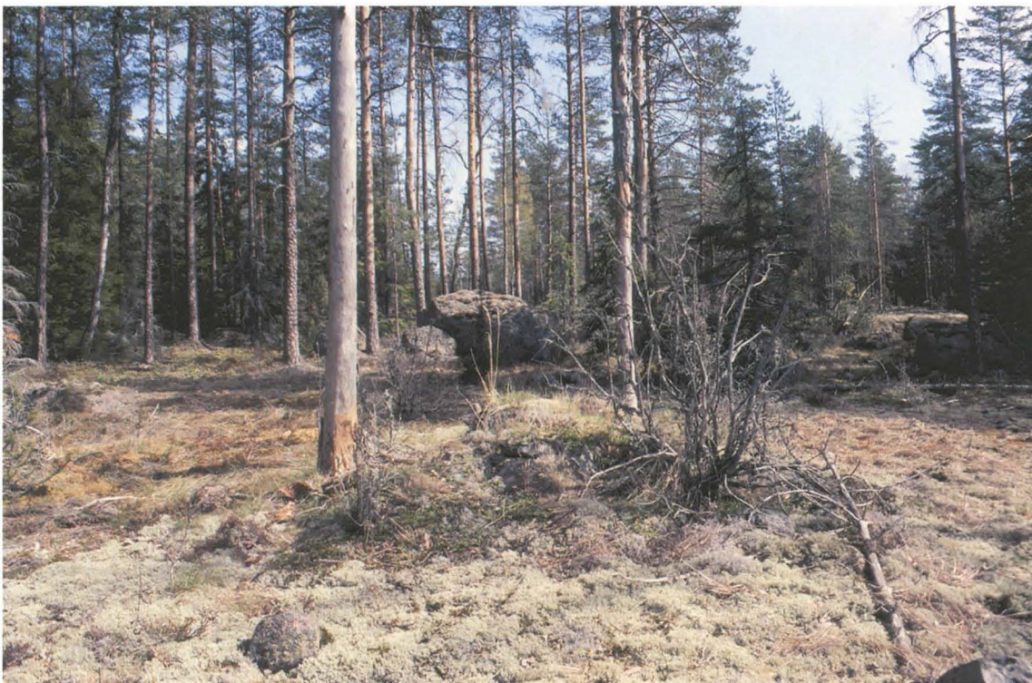
Kuva 2: Röykkiö suunnasta NW.