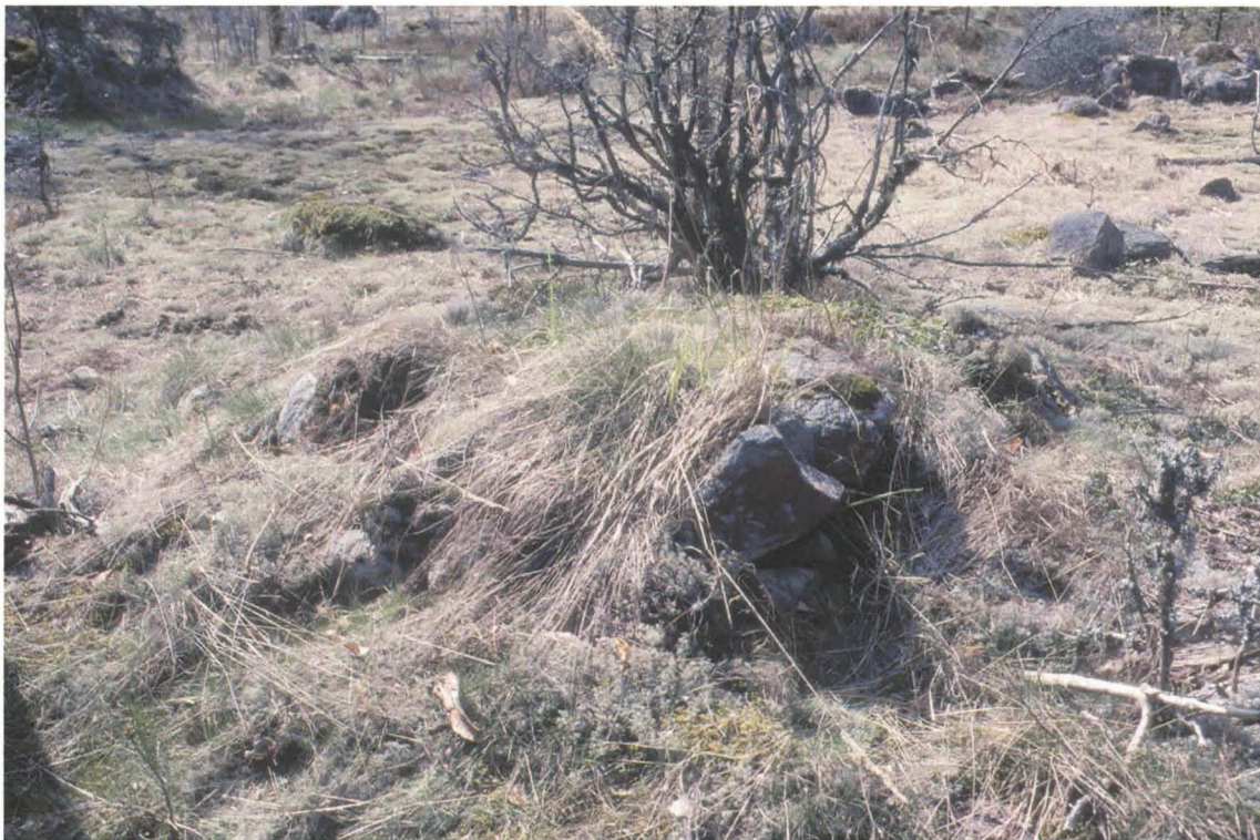
Kuva 1: Röykkiö suunnasta NE.