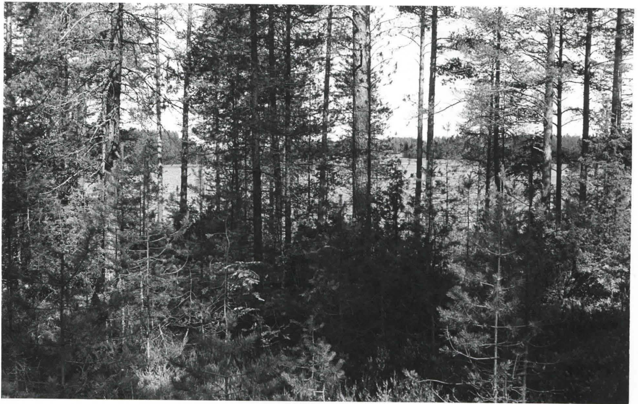
Lapinraunionsija etelästä kuvattuna, taustalla Kynsiveden Outamo.