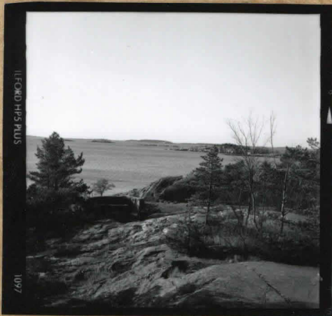
Näkymä länteen Lou- vaiskärjestä