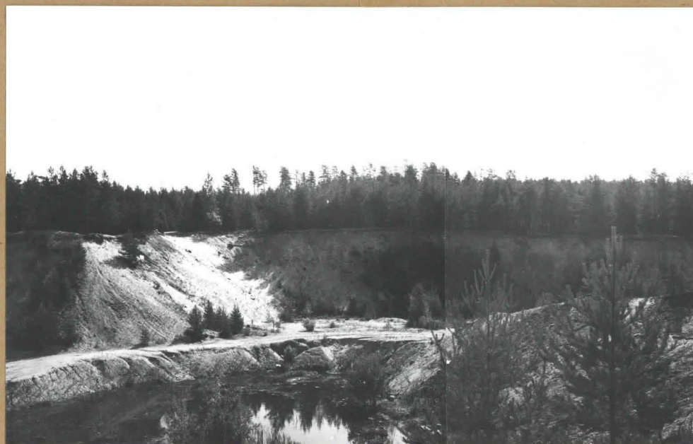
ff. 56175-56176 KOHDE D. W-E.