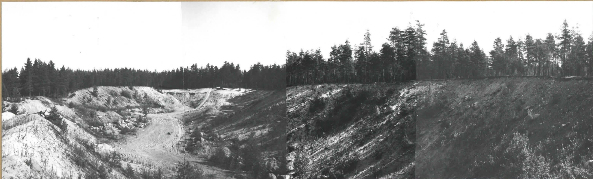
ff. 56171-56174 KOHTEET A, B JA C. S-N.