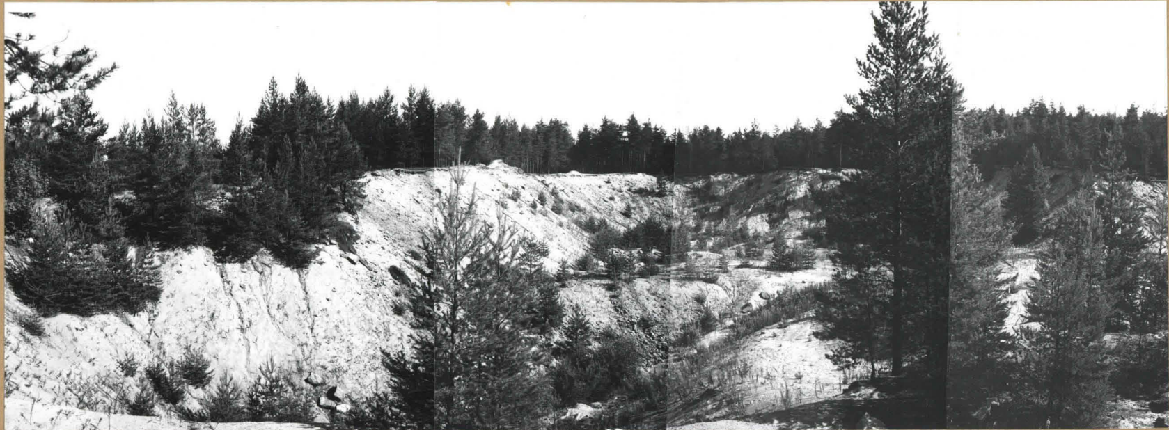
ff. 56177-56180 KOHTEET E JA F. SW-NE.