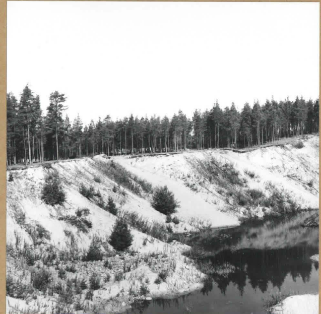
f. 56183 KOHDE H. SE-NW.