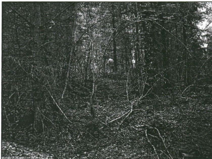
Asuinpaikkaa kuvattuna pohjoiseen kärjen rinteiden juurelta.

Muinaisen salmen länsirannalla on nyt kesämökki, jonka rannassa on kivirakennelma, joka on ollut ennen järvenlaskua aivan rannassa tai rantavedessä, matalan vanhan rantatörmän reunalla. Rakennelma tulkittiin vesirajalla olleen vene- tai nuottavajan, sekä laiturin perustoiksi. Kiveyksen näytti meille mökin omistaja.