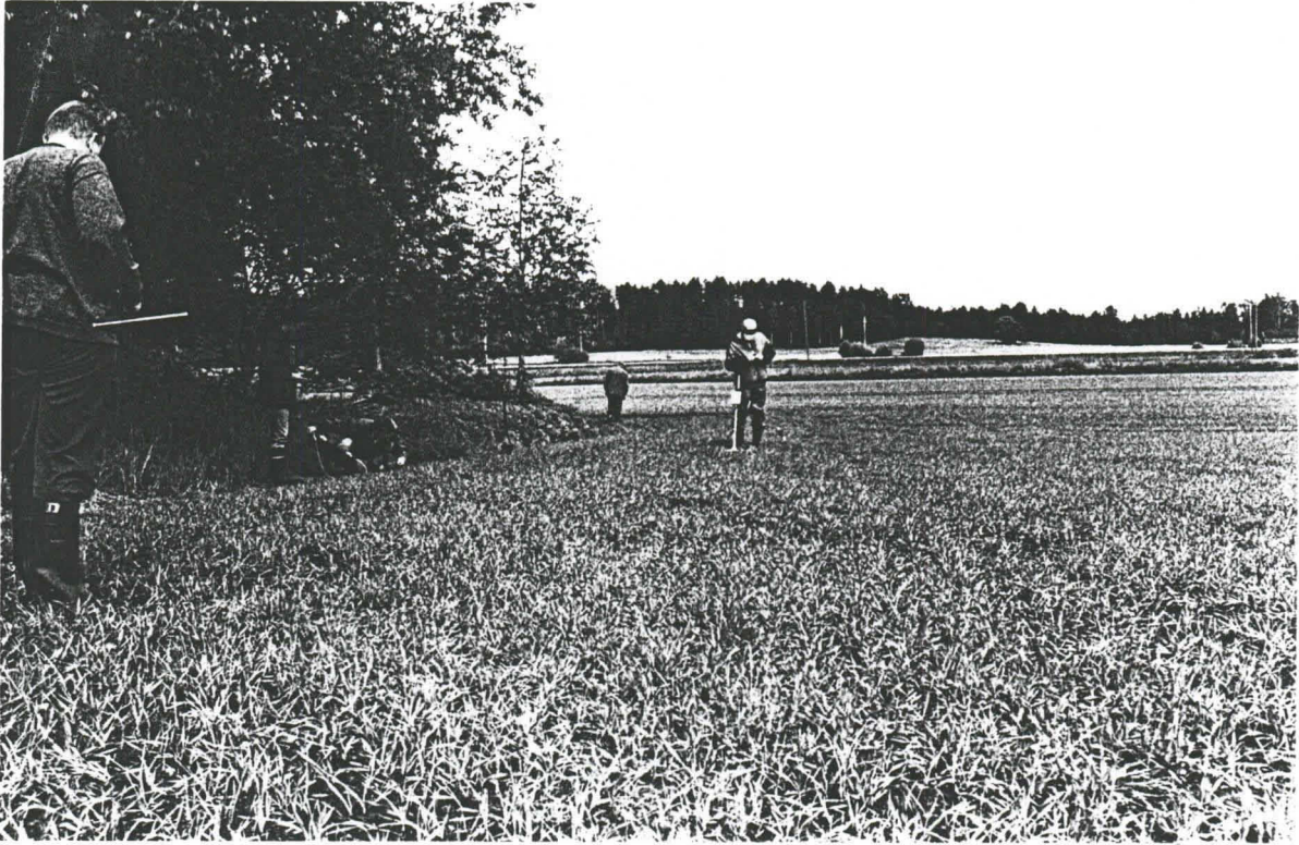
Hartola, Mäntykallio, 4.6.2001. Näkymä lännestä. Keramiikan löytöpaikka on lapion kohdalla. [LKM 129813]