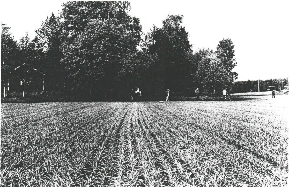
Hartola, Mäntykallio, 4.6.2001. Keramiikan löytöpaikka etelästä katsottuna. [LKM 129814]