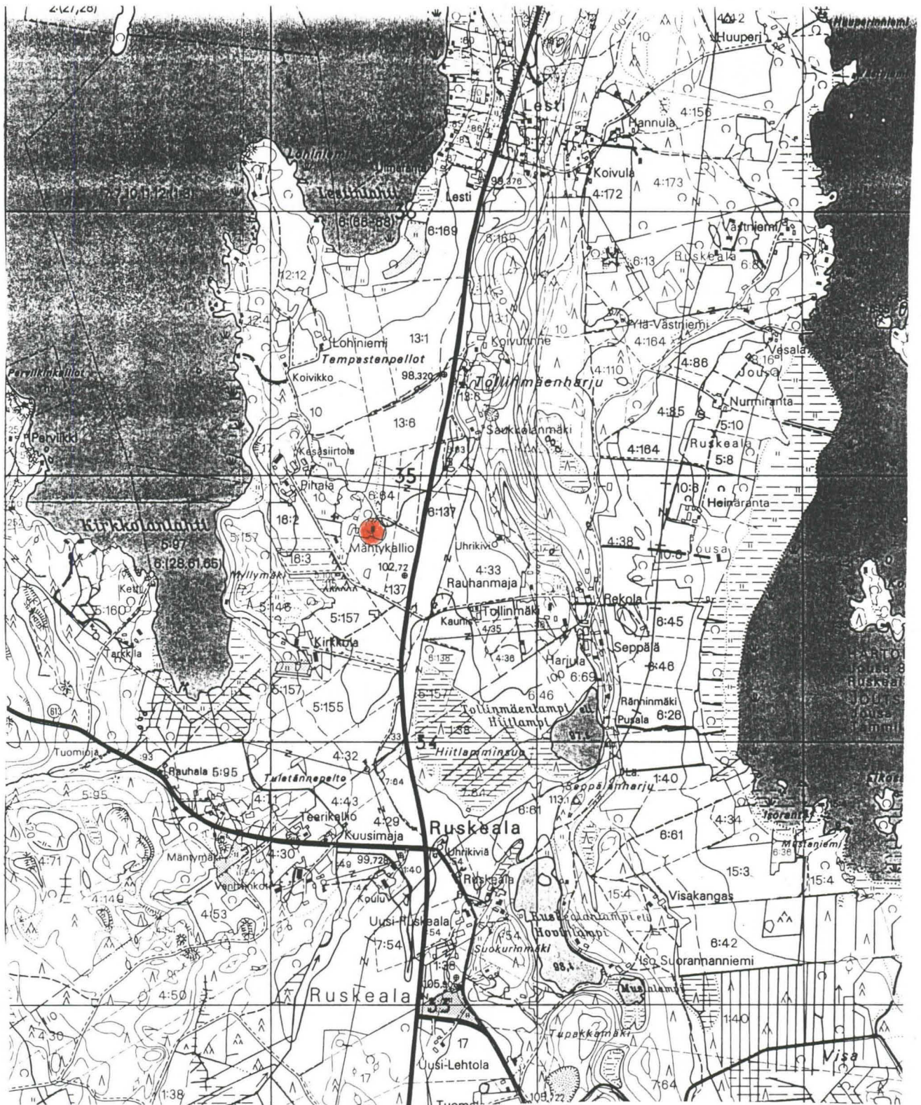
Pk-ote 3122 07 Hartola 1:20000 (1992)