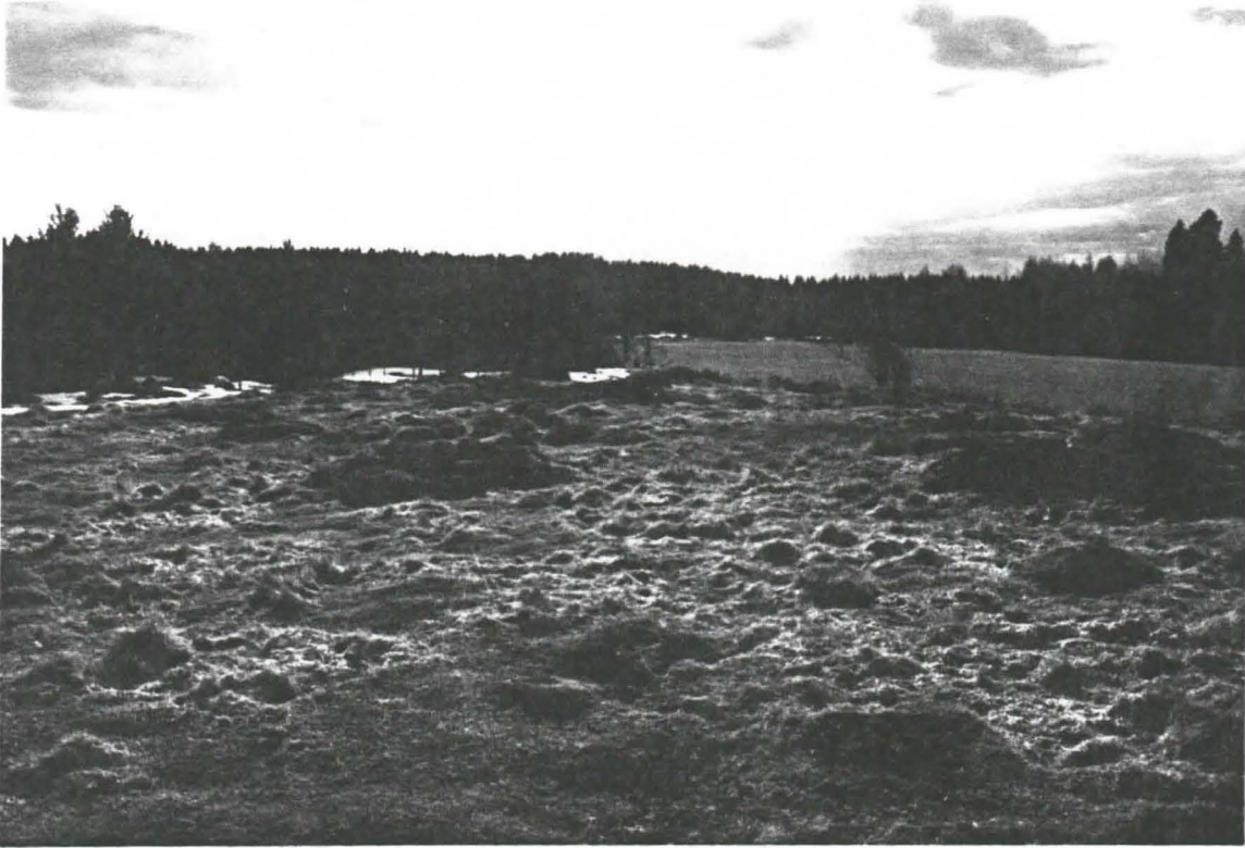
Kuva 3: Nuuttilanmäki 1. Pieniä matalia röykkiöitä. Kuvattu luoteeseen.