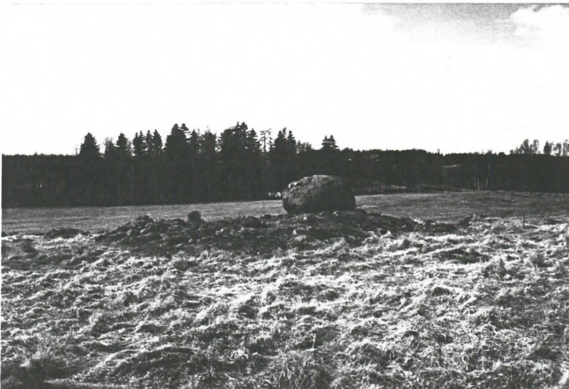
Kuva 2: Nuuttilanmäki 1. Silmäkivellinen röykkiö. Kuvattu pohjoiseen.