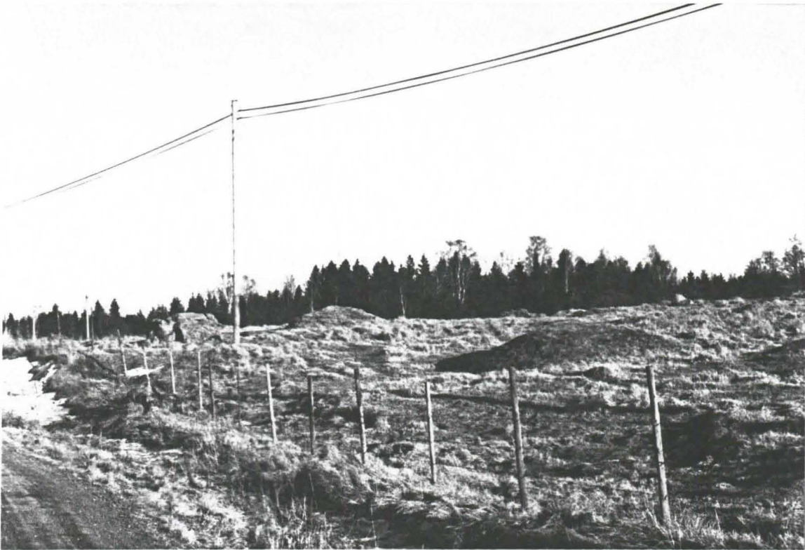
Kuva 1: Nuuttilanmäki 1. Maansekaisia kumpuja. Kuvattu kaakkoon.