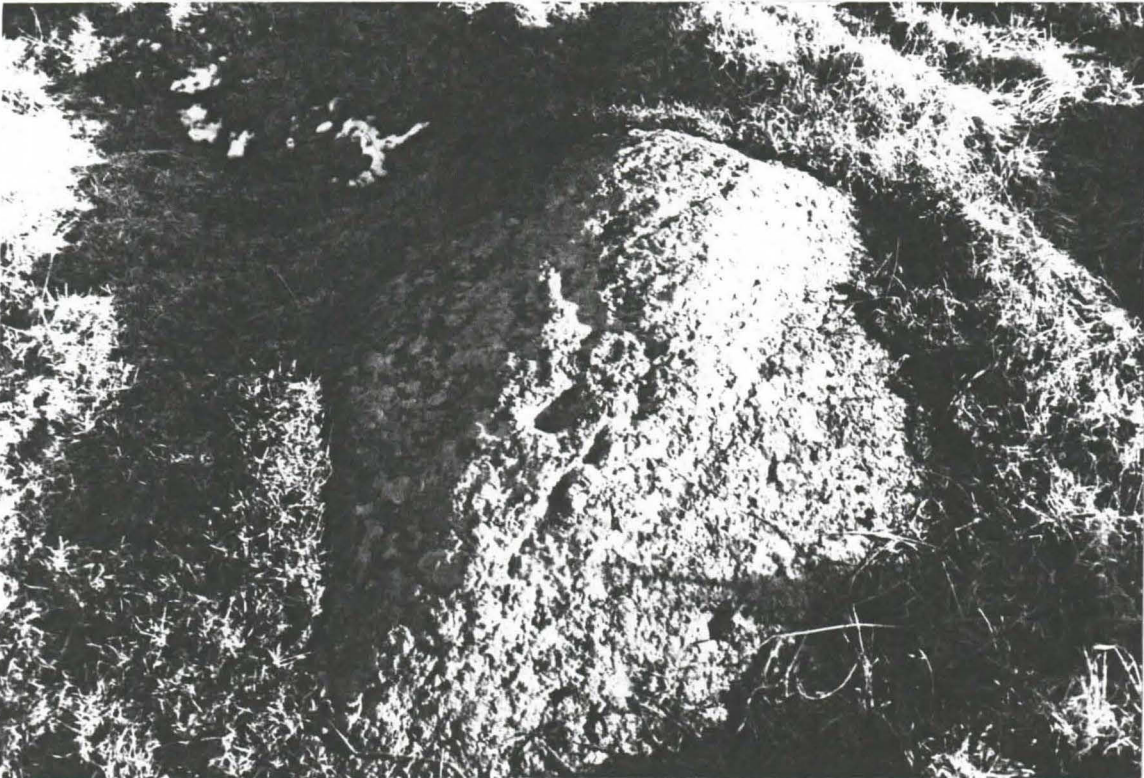
Kuva 4: Nuuttilanmäki 4. Kuppikallio.