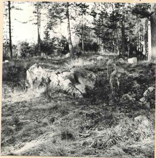
Elhikallio kuvattuna pelolta käsien. Luonon oikeassa lai- dassa on matala runno.