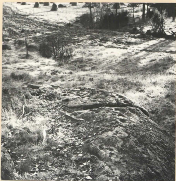
Elhikallio kuvattuna lännestä.