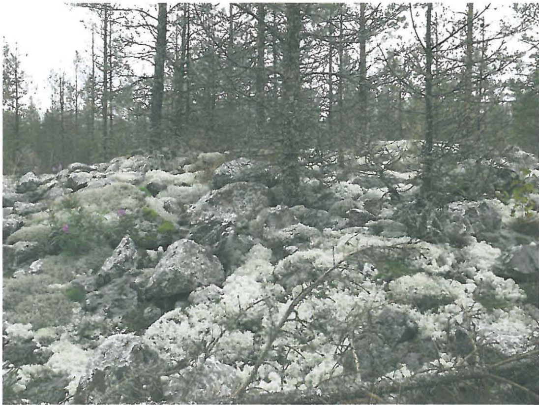
Kuva 3. Kohteen suurin røykkiö idästä kuvattuna.