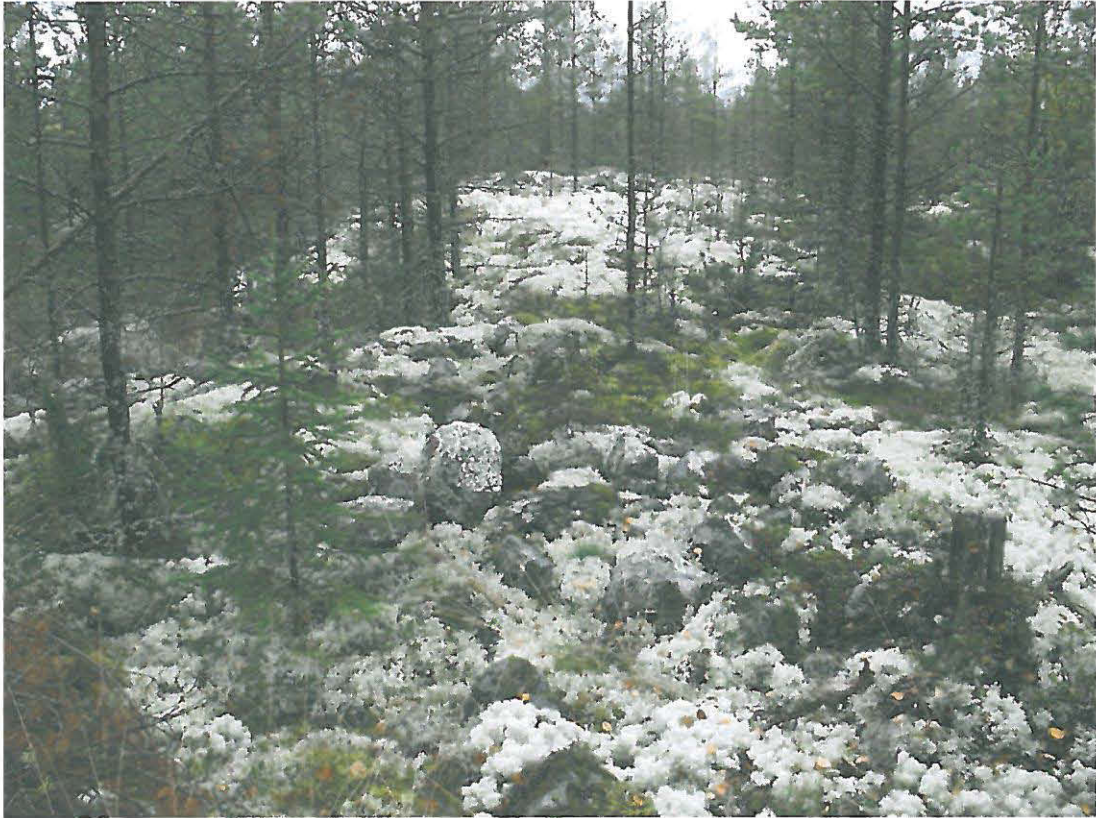
Kuva 5. Etualalla pienempi röykkiö, takana suurempi röykkiö.