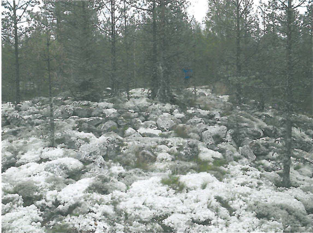
Kuva 1. Kohteen suurin röykkiö pohjoisesta kuvattuna.