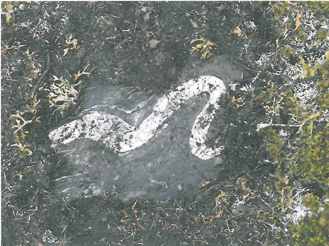
Kuva 6. Kalliopinnassa näkyvä kvartsijuonne.