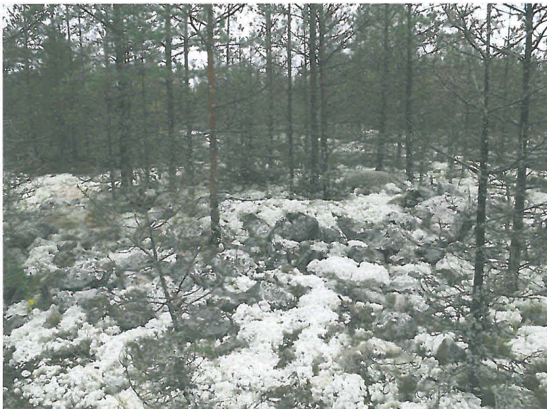
Kuva 2. Kohteen suurin röykkiö kaakosta kuvattuna.