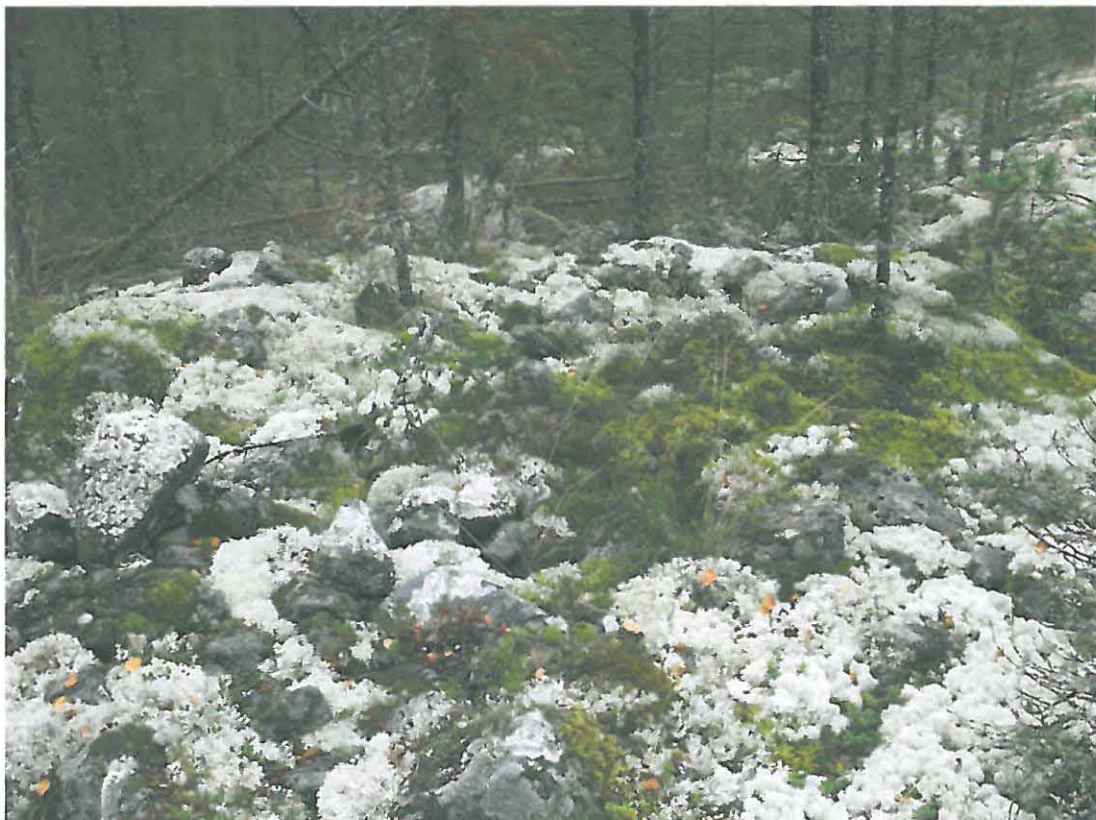
Kuva 4. Pienempi røykkiö idästä kuvattuna.