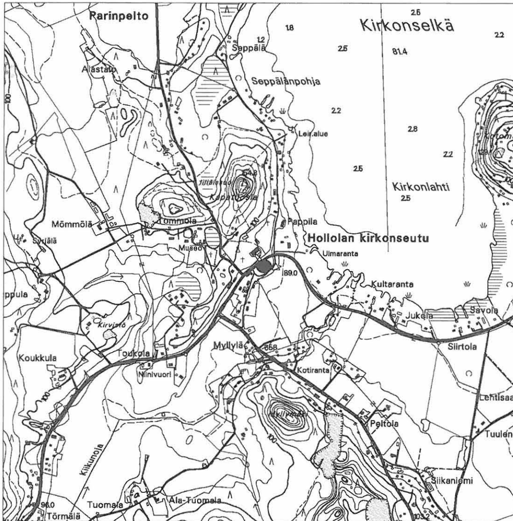
Pk 2134 10 Hollolan kirkonseutu 1:20 000 Maanmittauslaitos Perus- ja käyrät-cd Häme 2001