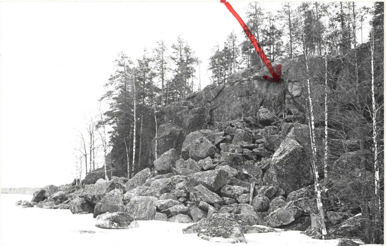
K.1 KALLIOMAALAUUS LIIDUTTUNA. HIRVI KATSOO ETELÄN.