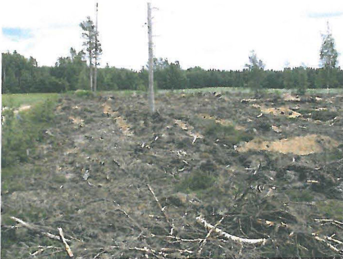
DG644:2 Vasennalla peltotie, aurattua muinaisjäännösalue, kuvattu lännestä