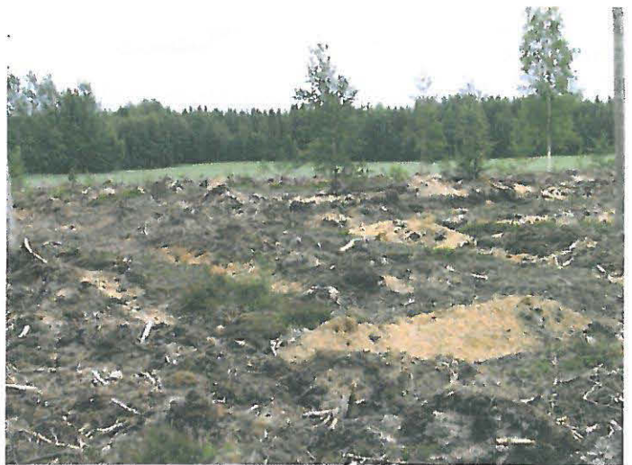
DG644:3 Aurattua muinaisjäännösalue, keskellä tervahauta, kuvattu luoteesta