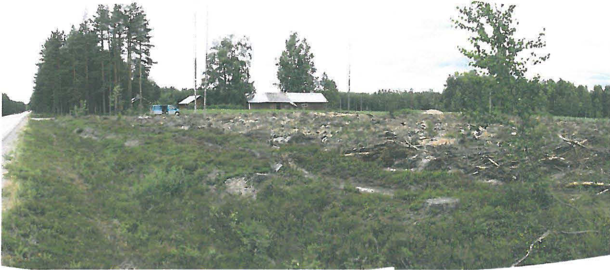
DG644:1 Hietarannan talo taustalla, edessä kaadettu ja aurattu metsikkö, jossa muinaisjäännösalue, kuvattu etelästä