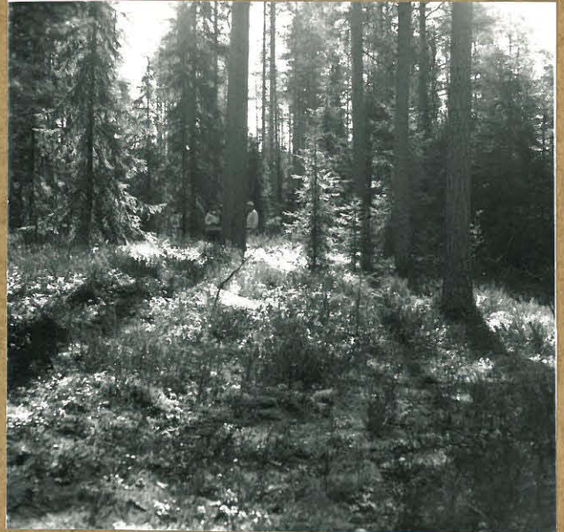
neg. 85822 Kodanpöytä sijaitsee rantaterassilla alueella Sasanteella NW.