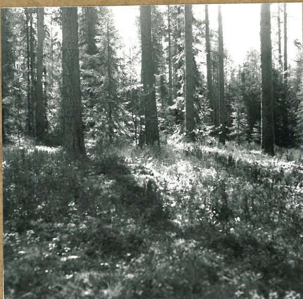
neg. 85823 Rantaterassi, jolla asuinpaikka -alue sijaitsee. W-NW.