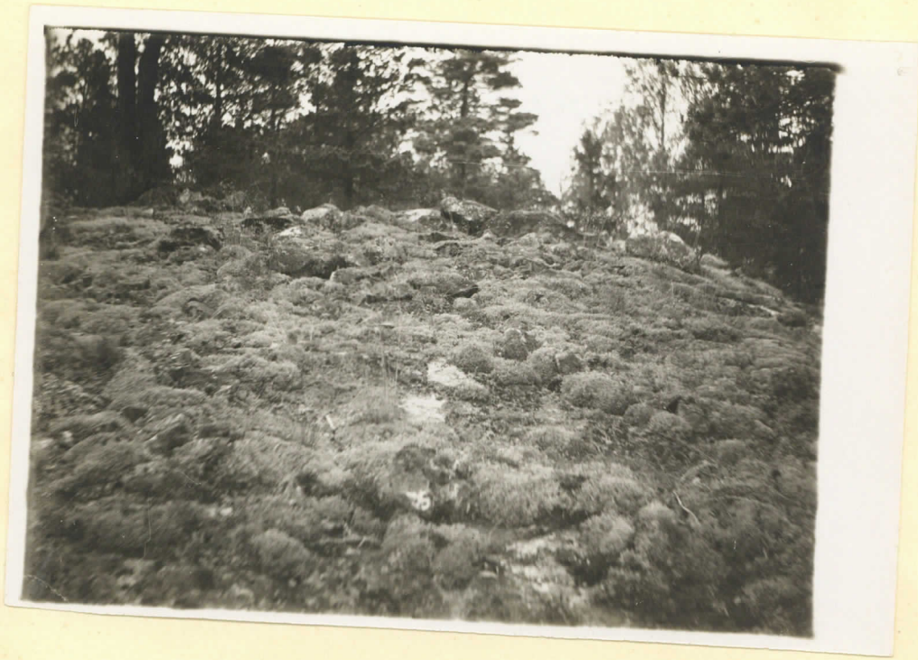
N:o 10 Klammel Sunneberg Bildet taget från 9. Augusti 1930