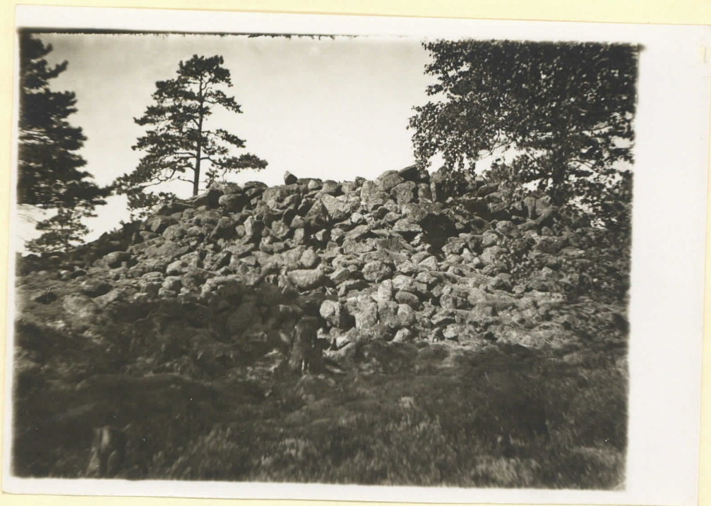
N:o 7 Hummel Dalhaby. Bildan tagen från S. O. Augusti 1930