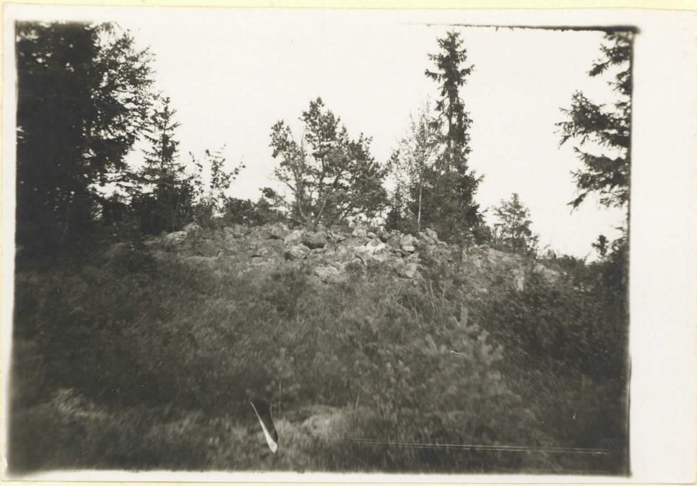
No 8 Klummet Dalhärby Bildet taget från S. V. Augusti 1930