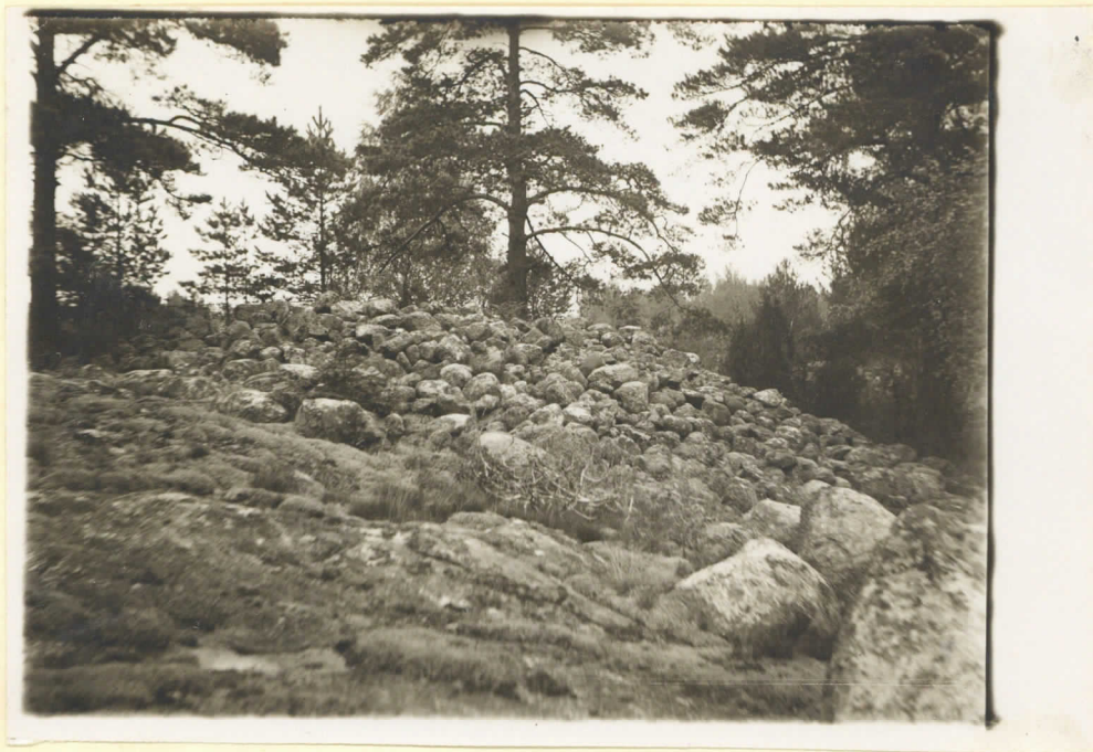
No 3 Klummet Dalkarby