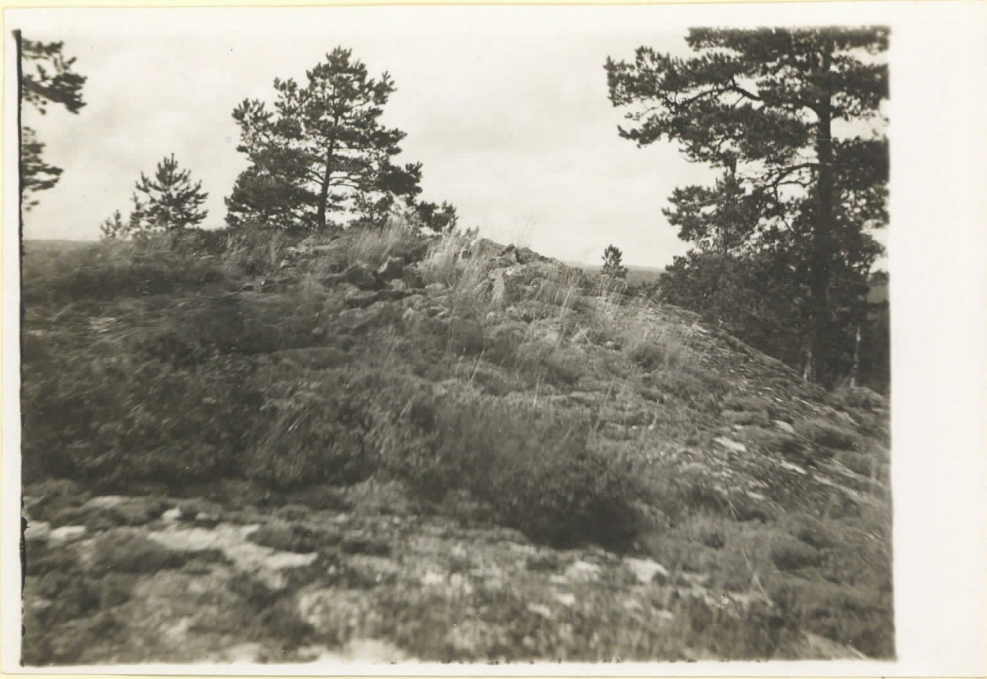
No 4 Klummet Dalharby Bildan tagen från Ö. Augusti 1930