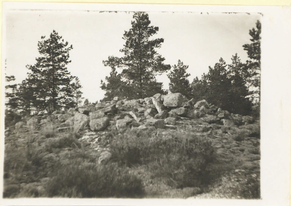
No 5 Klummet Dalharby Bildan tagen från S. Ö. Augusti 1930