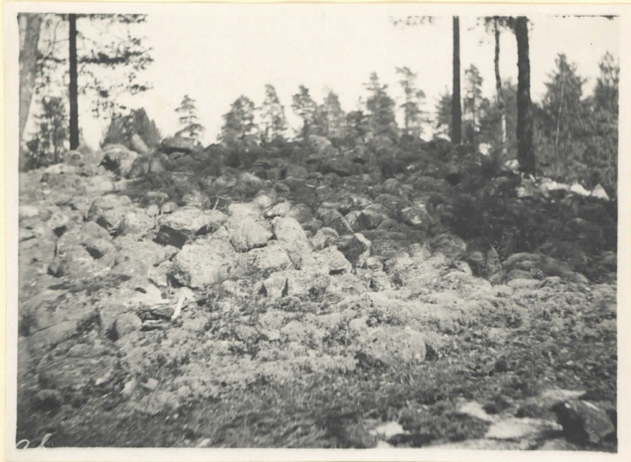
No 1. Flummet, Larsberg (Mörby)