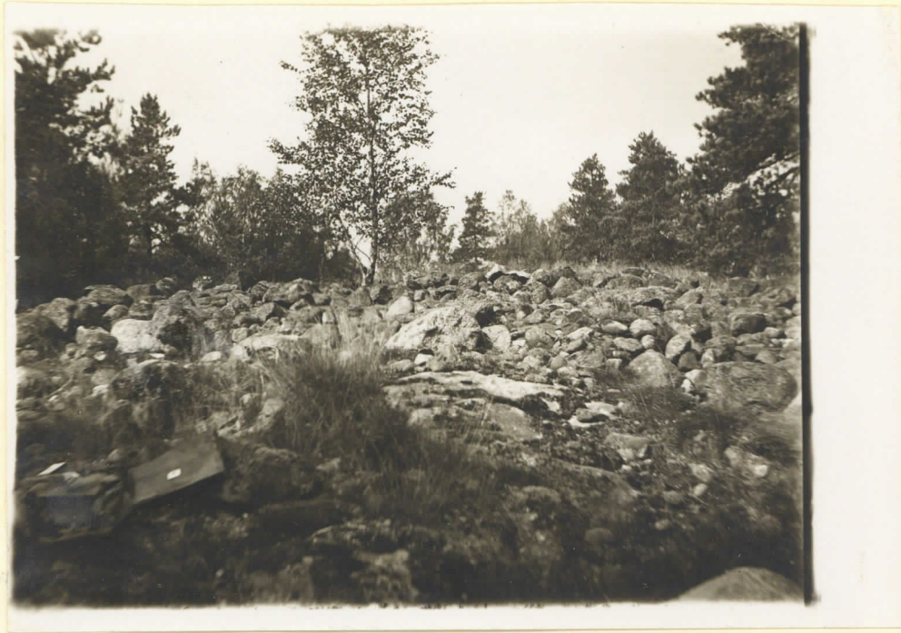
No 2 Klummet Dalkarby