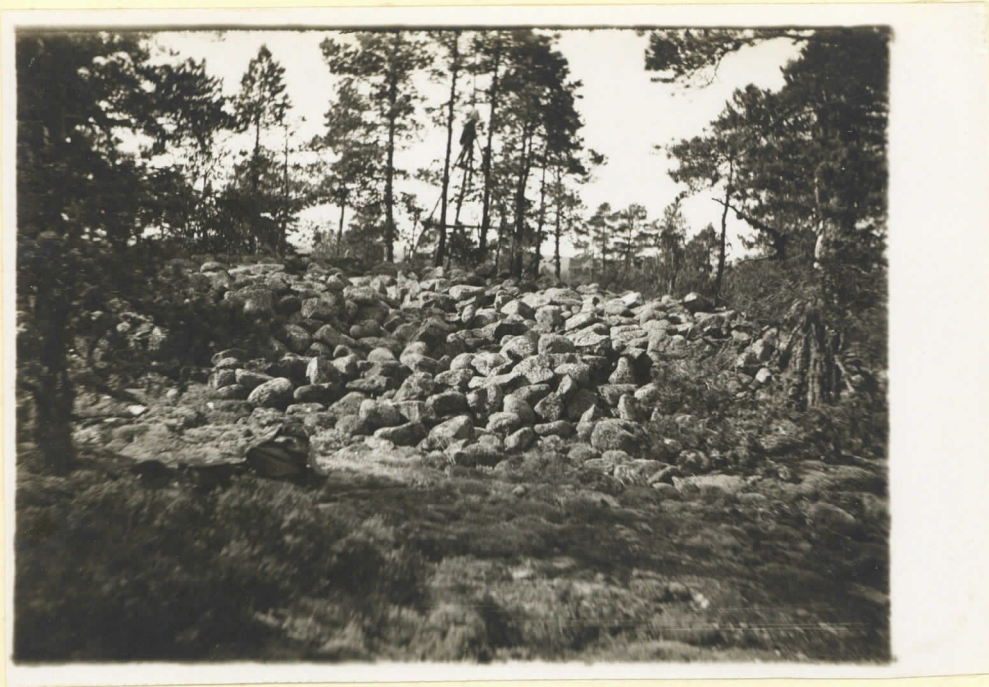
N:o 6 Hummel Dalhaby Bildan tagen från S. O. Augusti 1930