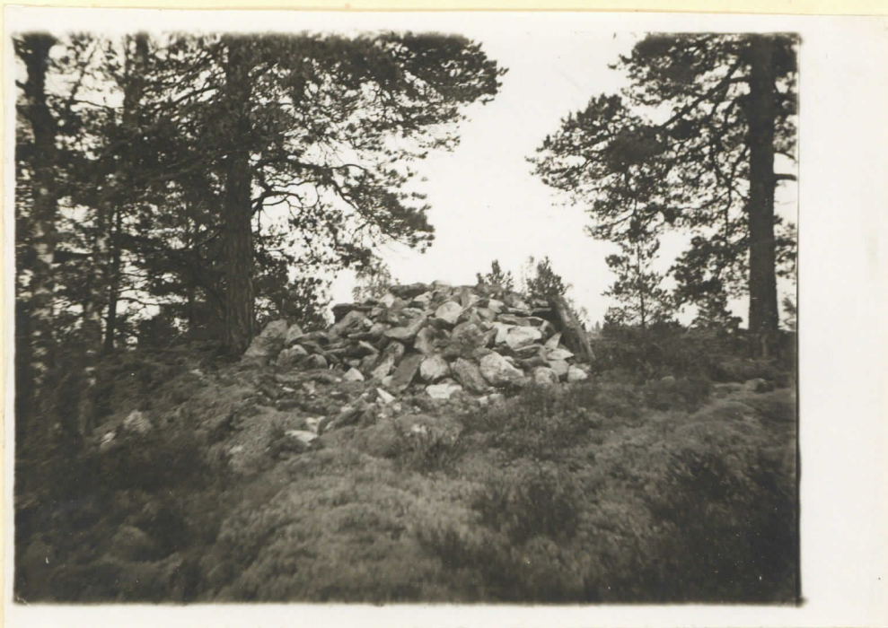
No 9 Klummet Sunneberg Bildet taget från V. Augusti 1930