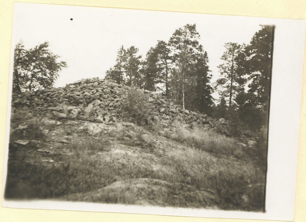
N:o 11 Klammel Klarberget Pajo kyrkby. Bildet taget från 9.0 Augusti 1930