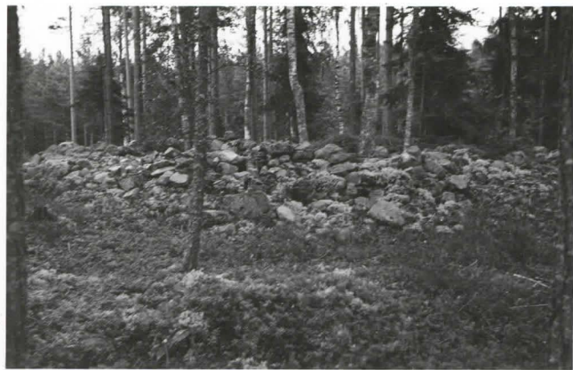
Kuva 5. Röykkiö N o 13 (F18037)