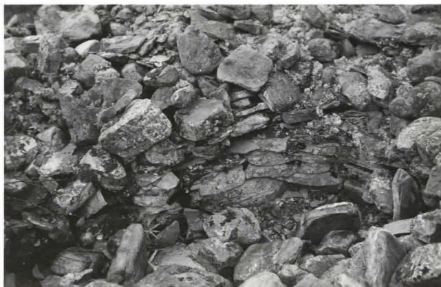
Kuva 8. Röykkiö № 16. Röykkiön oleva osan. (F18040)