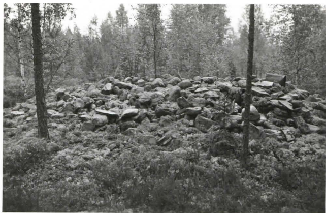
Kuva 7. Röykkiö № 16 (F18039)