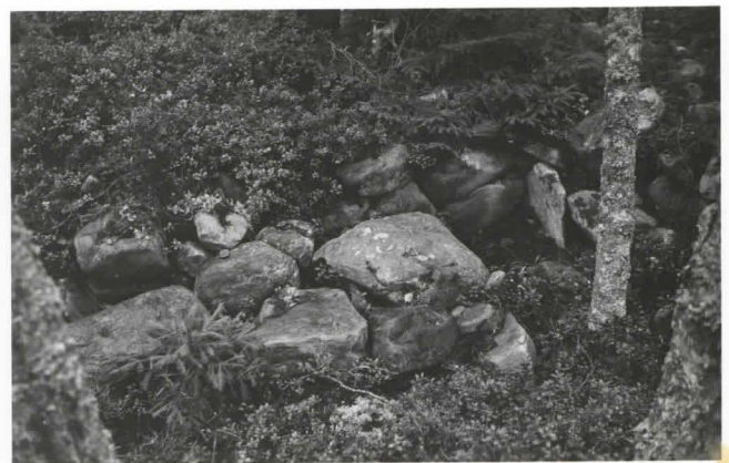
Kuva 6. Röykkiö N o 13. Röykkiön keskellä oleva arkku. (F18038)