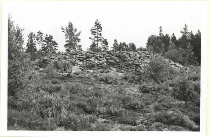
Kuva 4. Röykkiö N o 6. (F18036)