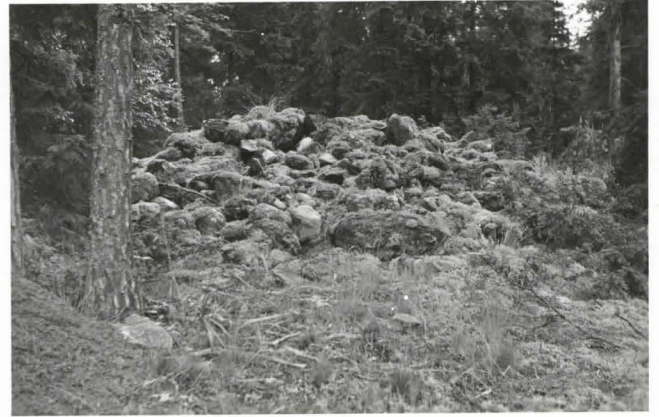
Kuva 2. Röykkiö N o 2. (F18034)