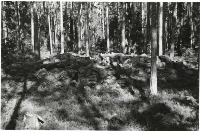
Kuva 3. Röykkiö N o 3. (F18035)