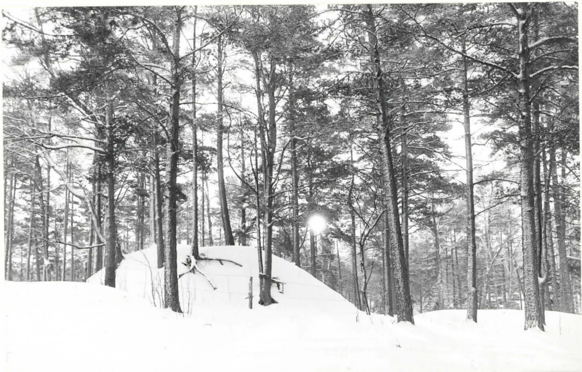
K. 8. KUMPU I, LA:NNESTÄ KUVATTUNA