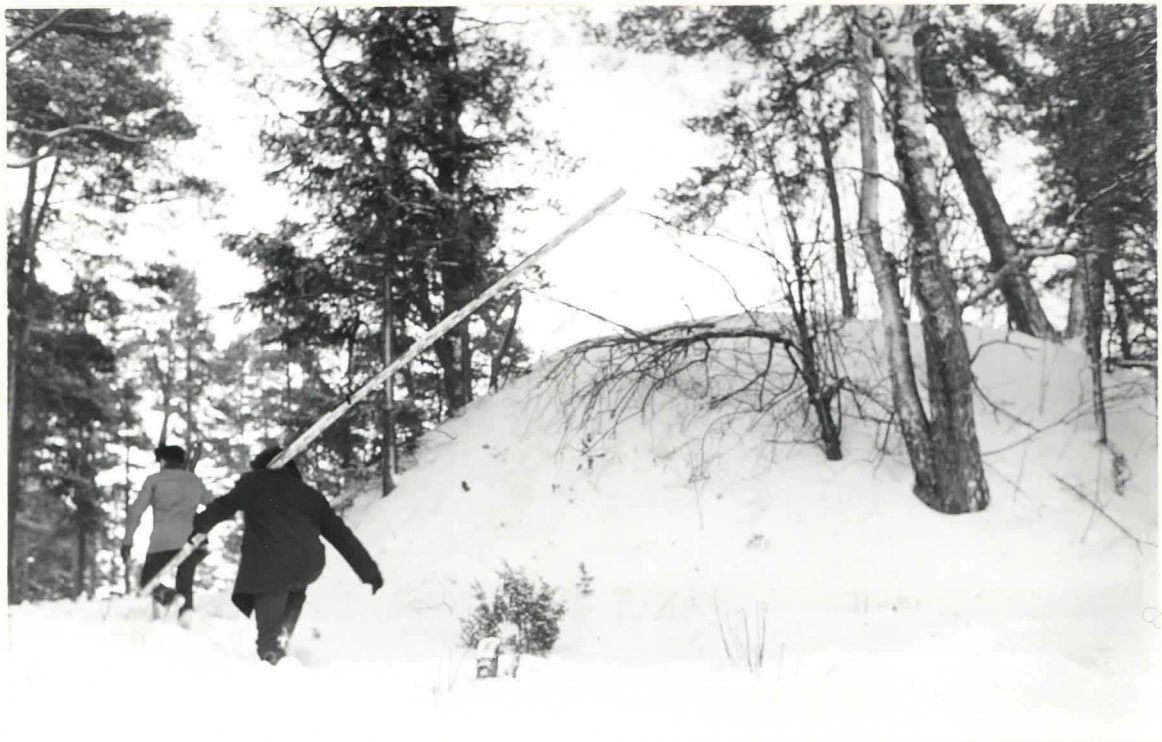
K.6. KUMPU III.