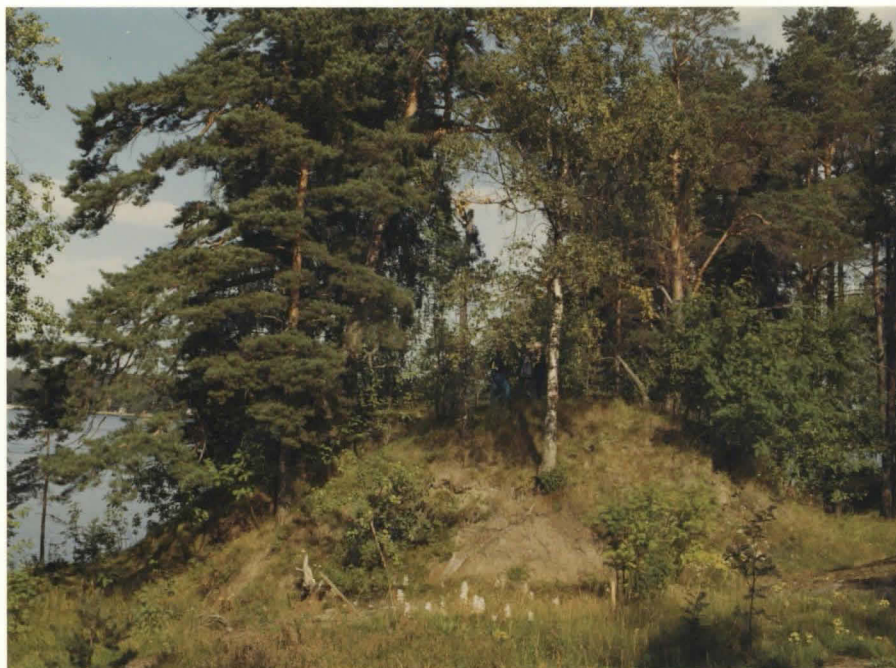
K.4. KUMPU III KAAKKOIS- JA ETELA-REUNA