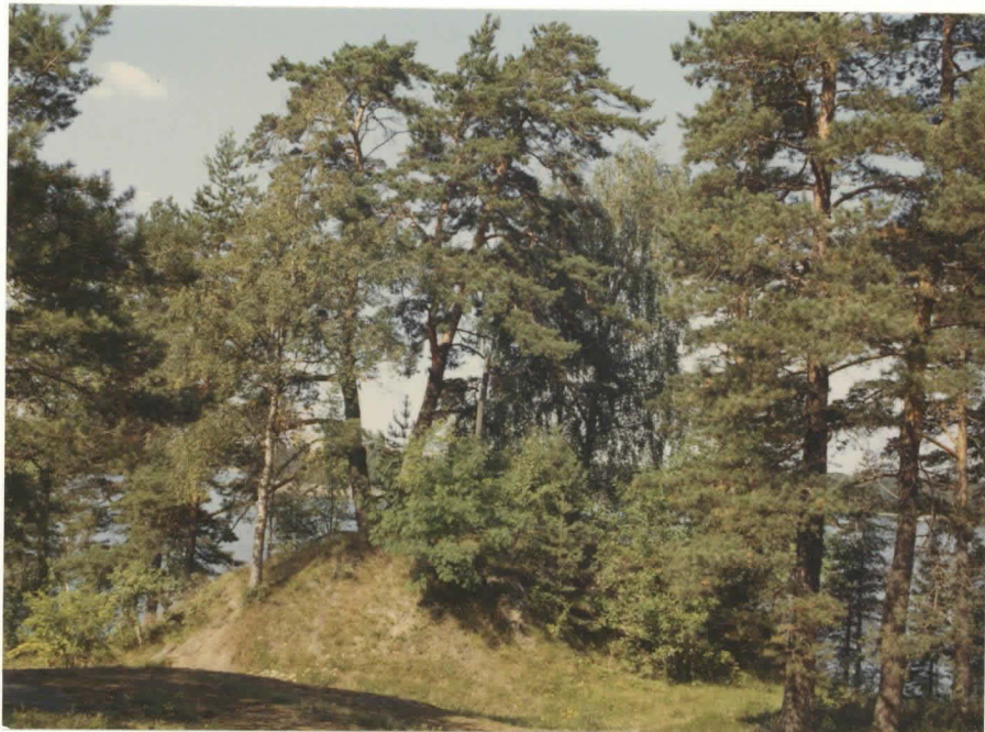
K.3. K. III . ITÄ PUOLI