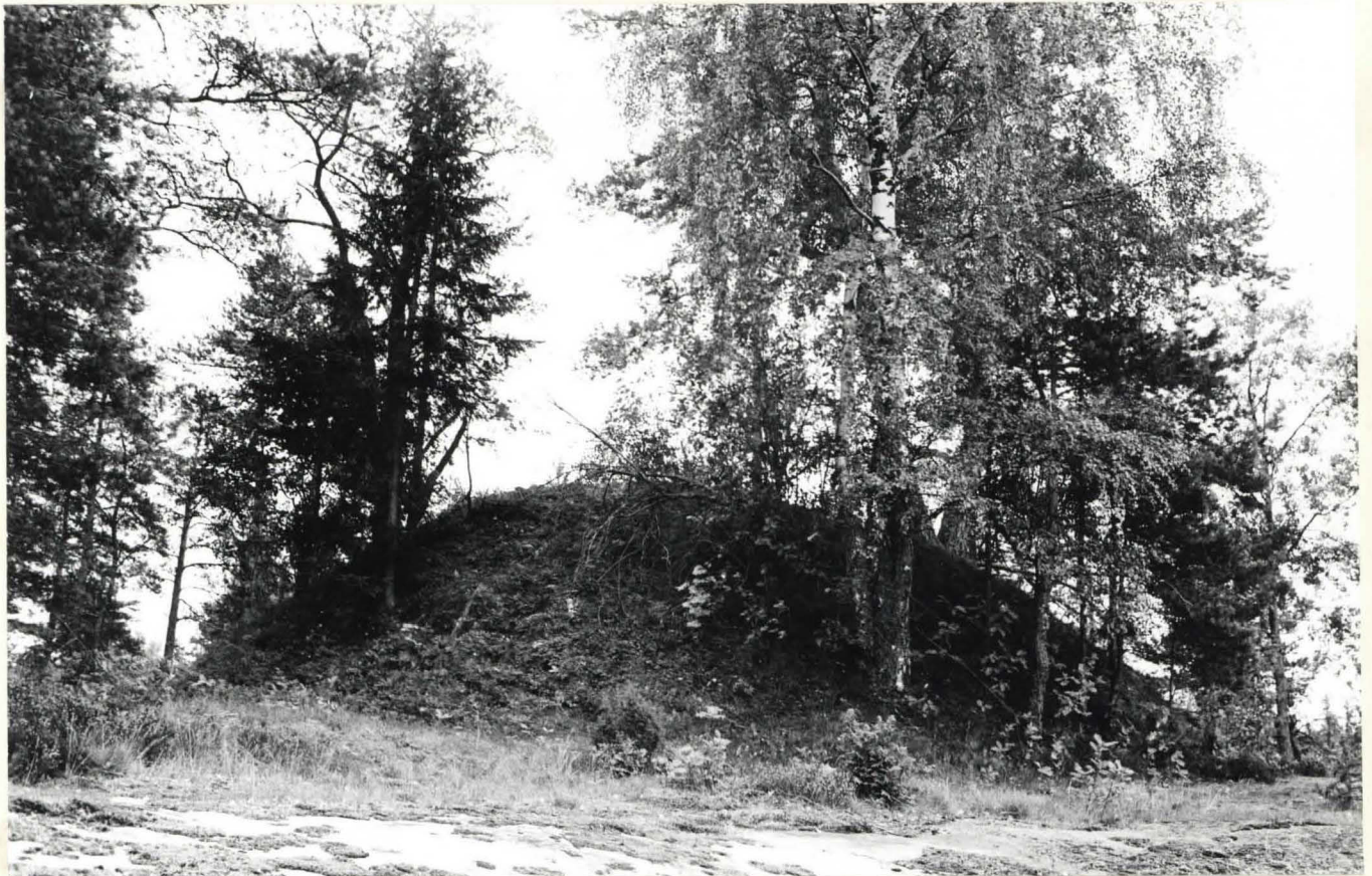
K.2. KUMPU III LÄNSIPUOLI