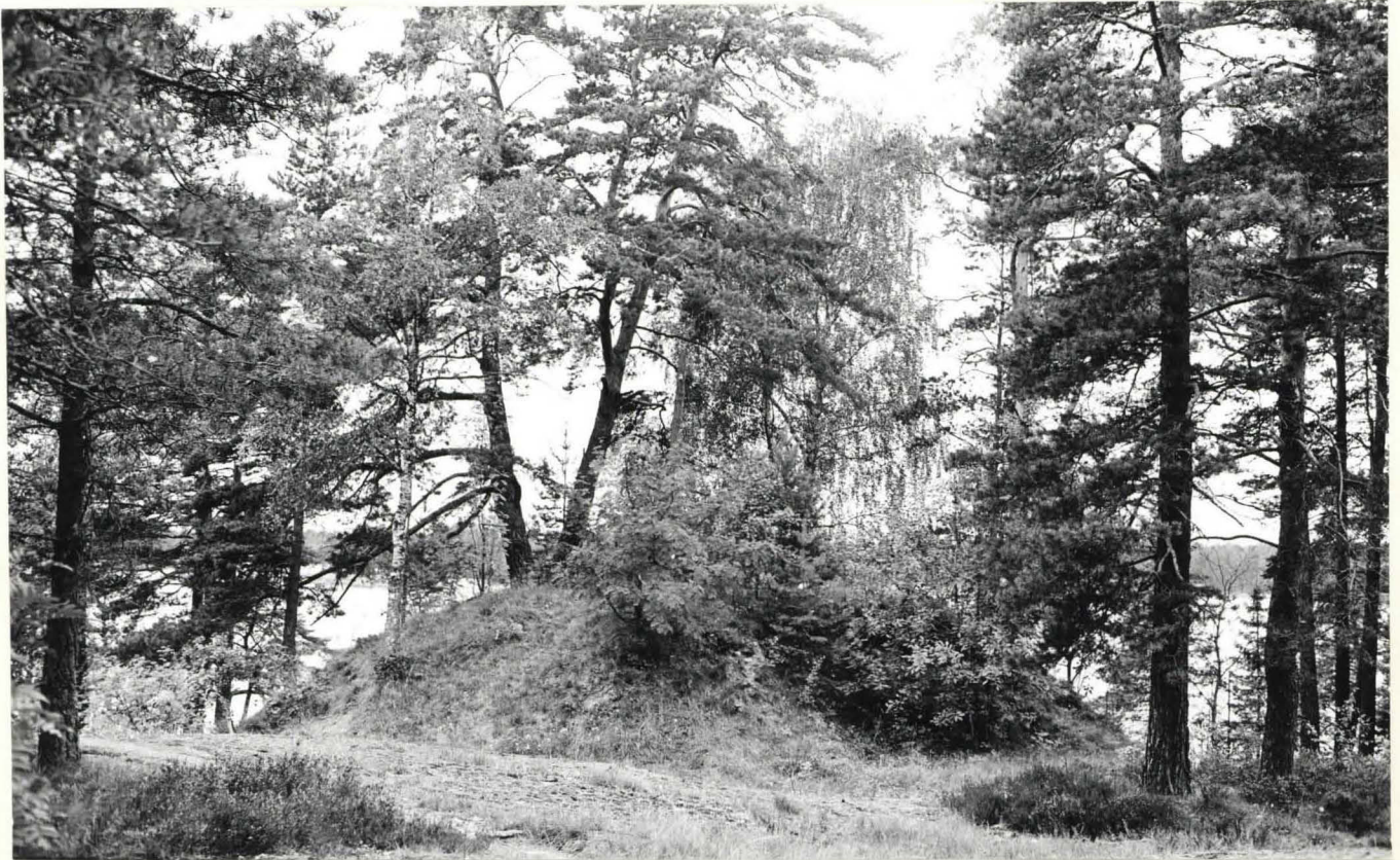
K.1. KUMPU III, ITÄPUOLI