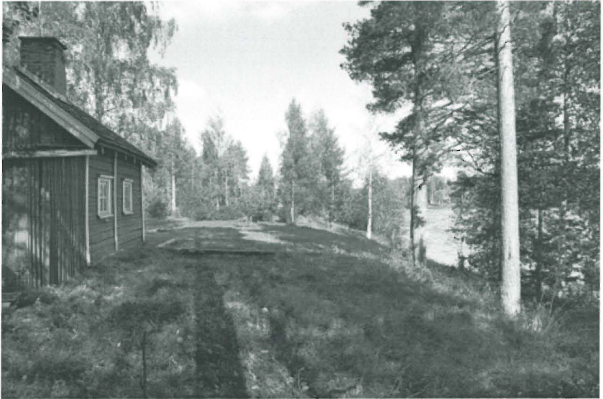
Kuva 3. Rantatasannetta alueen eteläosassa, vasemmalla sauna. Kuvattu etelästä. KaiM 7526:7