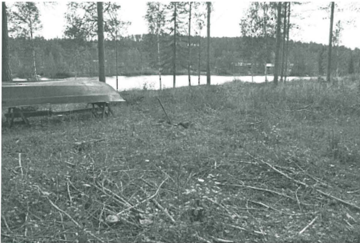
Kuva 1. Suunniteltu saunan paikka. Kuvan keskellä näkyvä lapinvarsi on saunan keskivaiheille kaivetussa koepistossa. KaiM 7526:5.