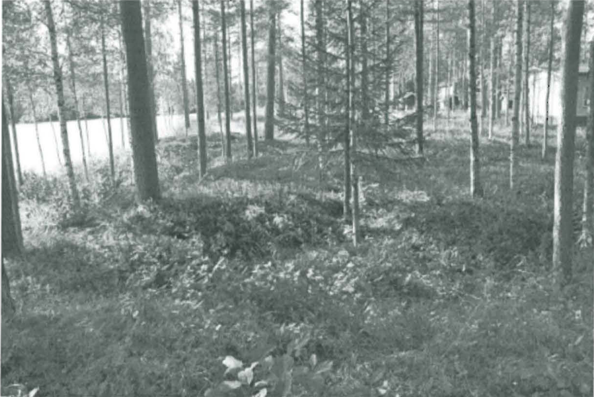
Kuva 1. Kohde pohjoisesta. Edessä sota-aikaisen varustuksen jäännös, suunnitellun saunan paikka oikeassa reunassa näkyvän vaalean tiilitalon kohdalla rantatörmän päällä. KaiM 7526:1.