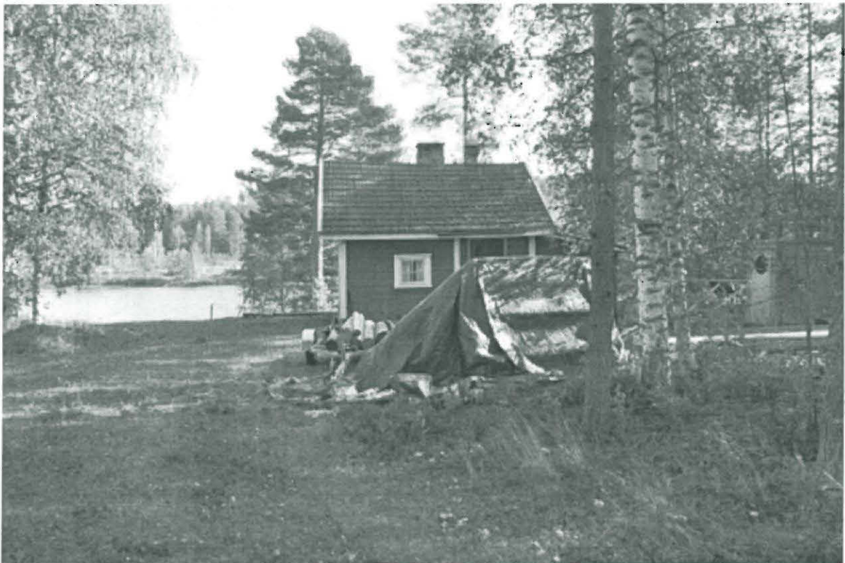
Kuva 4. Rantasauna lännestä, taustalla Emäjoki. Saunan vasemmalla puolella näkyy lapion varsi yhdestä koepistosta. KaiM 7526:9