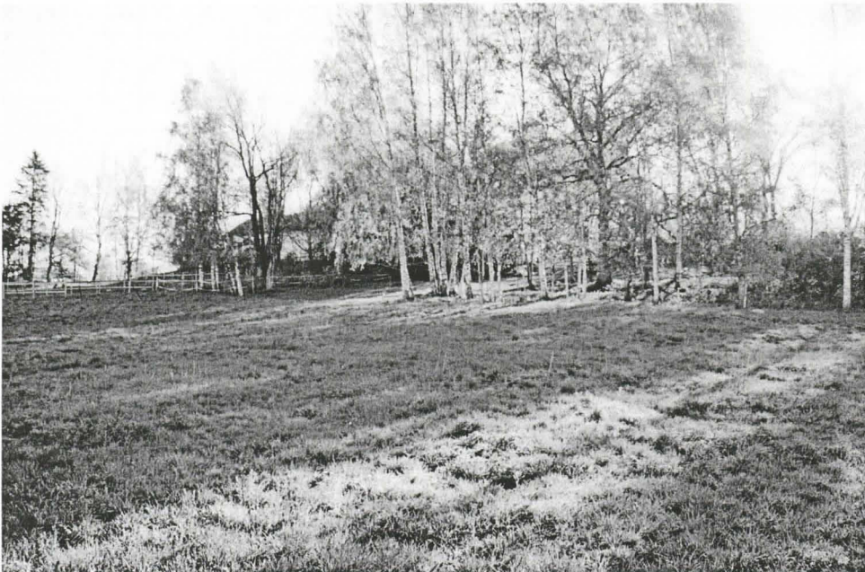
f.145313:3. Hämeenlinna Aulanko 1. Yleiskuva. Kuvattu lännestä.