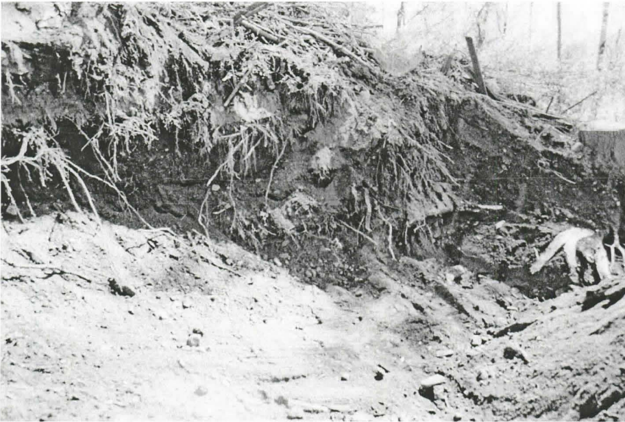
f.145313:1. Koneella kaivetun alueen pohjois-etelä suuntainen profiili. Sekoittunutta maata oli yli kaksi metriä. Kuvattu lännestä.