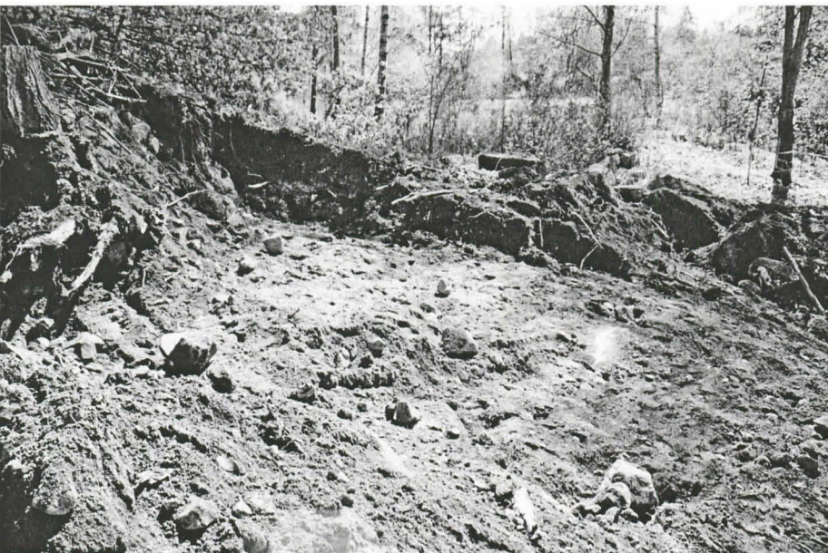
f.145313:2. Kuvassa näkyy koneella kaivettua maata. Kuvattu pohjoisesta.