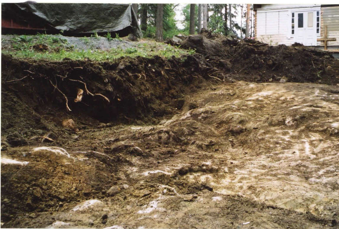
H4 Perustuskuopan itäreunaa