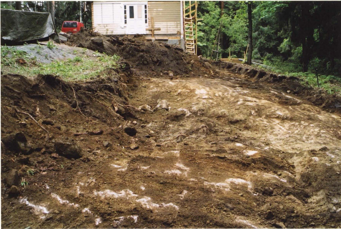
H3 Perustuslaivan itäreunaa