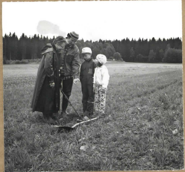
§ 114527 Metallinpaljastimen käyttöä. K11