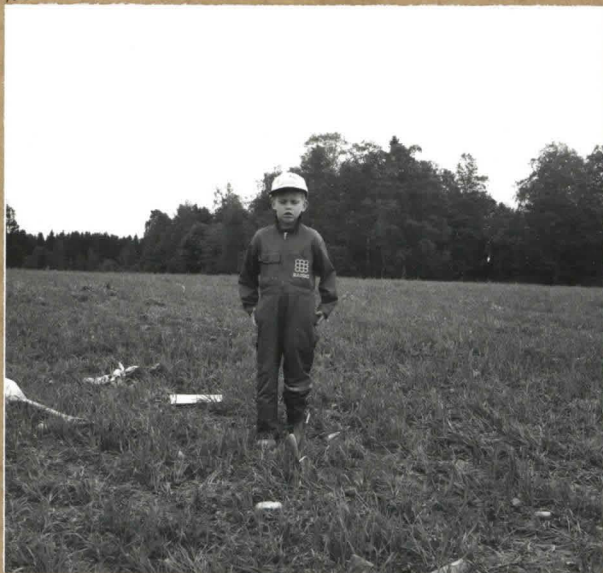
§ 114520 Maanviljelijä Sallin poika,