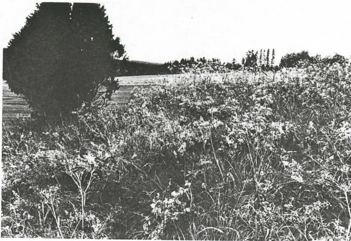
Kuva 2. Hämeenkyrö, Kierikkala, Heikkilä. Rauniot 1 ja 2 pohjoisesta. (Kuv. Arja Karivieri 1985, TYA 11071)