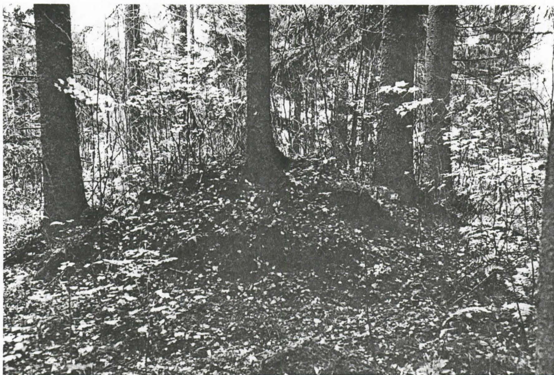
Kuva 3. Hämeenkyrö, Kierikkala, Nikkilä. 1-raunio lännestä.