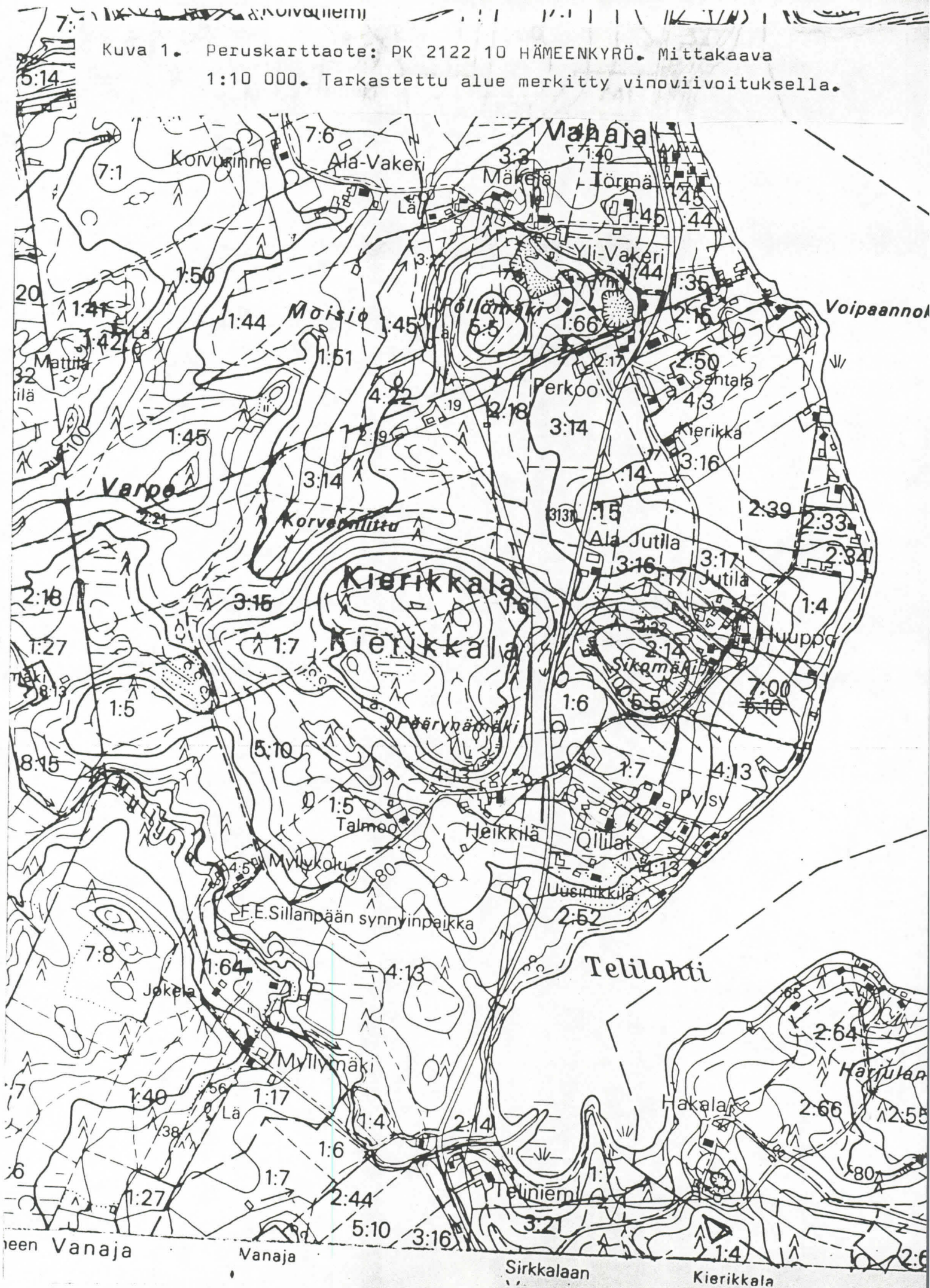
Kuva 1. Peruskarttaote: PK 2122 10 HÄMEENKYRÖ. Mittakaava 1:10 000. Tarkastettu alue merkitty vinoviivoituksella.