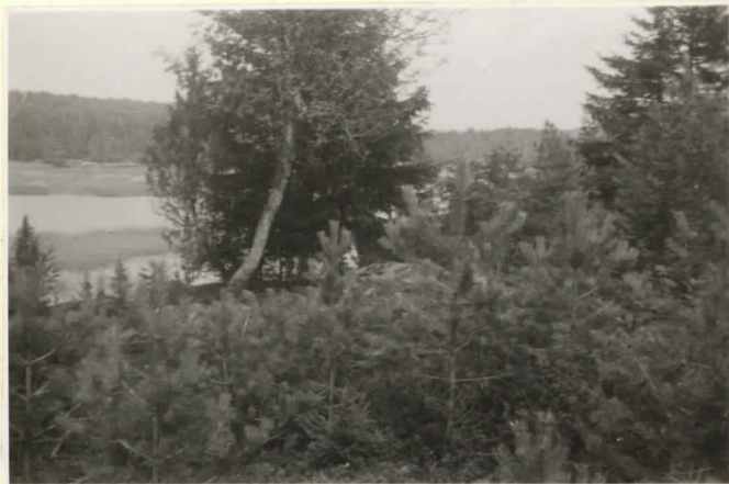
10831 Björnholm Norrby. Mellan buskarna ligger röse nr 2 från S 20.7.36.