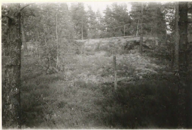
Stenhav vid p. 59.5 Berg- by 21.7.36