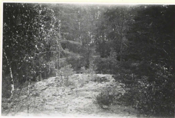
10825 Utsikt från större röset å Kastalberget. Mellan träden skym- tar mindre röset. I bakgrunden sjön. 3.6.36