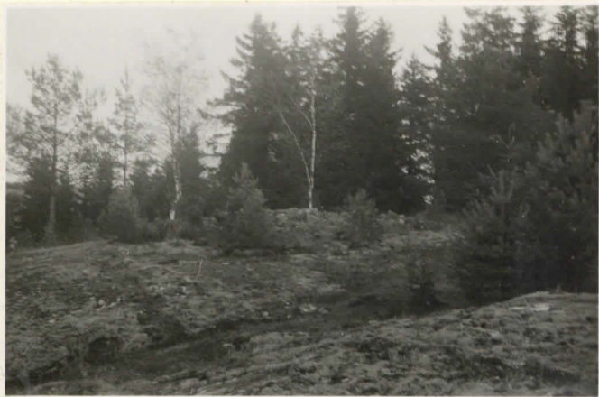
10832 Röse nr 1 å Björnholm Norrby från SW 20.7.36