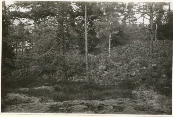
Stenhav vid p. 59.5 Berg- by. 21.7.36