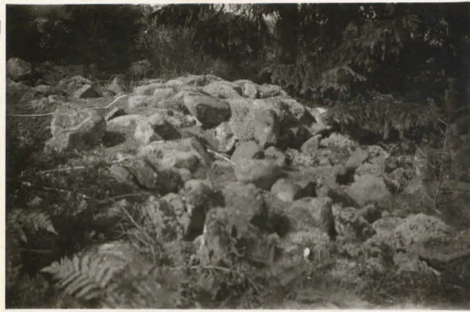
10830 Röse nr 2 å Björnholm Norrby fr. S NW 20.7.36.