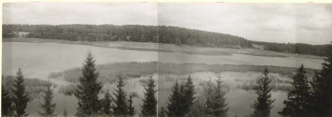
10823 10824 Utsikt över Kastalberget från söder (från Björntotm). Rösenä befinna sig ovanför den vita båten.