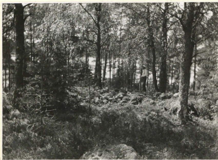
10826 Mindre röset å Kastalberget från öster. I bakgrunden sjön. Den vita mös- san är fil. kand. Börje Mårtensson