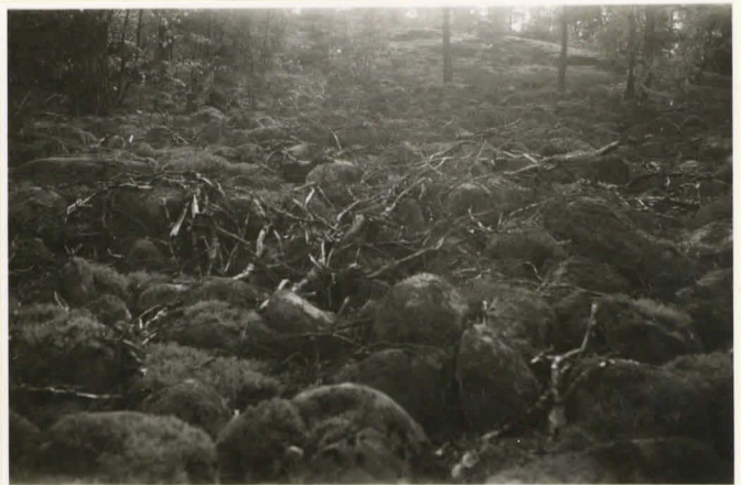
Stenhav vid p. 59.5 Bergby 21.7.36