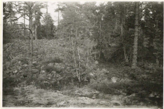
Stenhav vid p. 59.5 Bergby 21.7.36