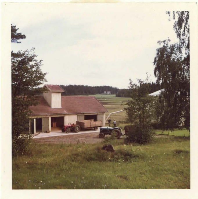
KUMPU, JOSSA UHRIKIVI TAKANA OLEVAN VALKOI SEN TALON KOHDALLA. KUVATTU NUKARIN PI HALTA ITÄÄN.