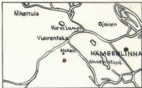
HÄMEENLINNAN MLK. NUKARI. UHRIKIVEN SIJAIN- TI MERKITTY PUNAISELLA 1:100 000