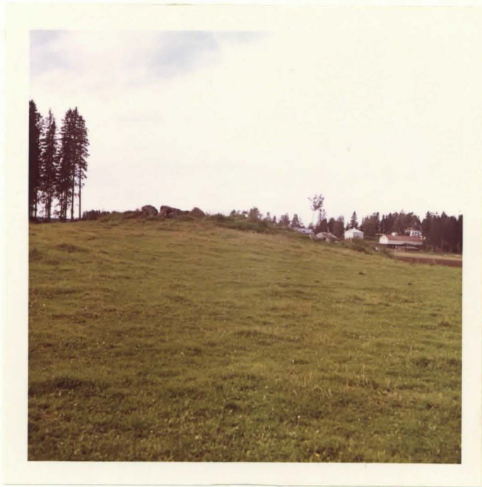
KUMPU, JOSSA UHRIKIVI. TAUSTALLA NUKARIN PÄÄ - ULKORAKENNUK SIA