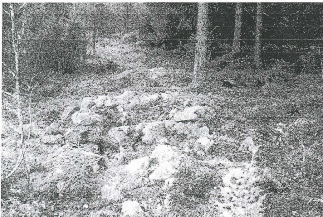
121614 Kiveys koillisesta.