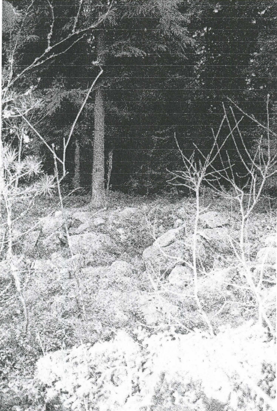
121616 Kiveys idästä. Keskellä syväne, jossa on kasvanut kuusi. Kohtaa on myös pengottu.