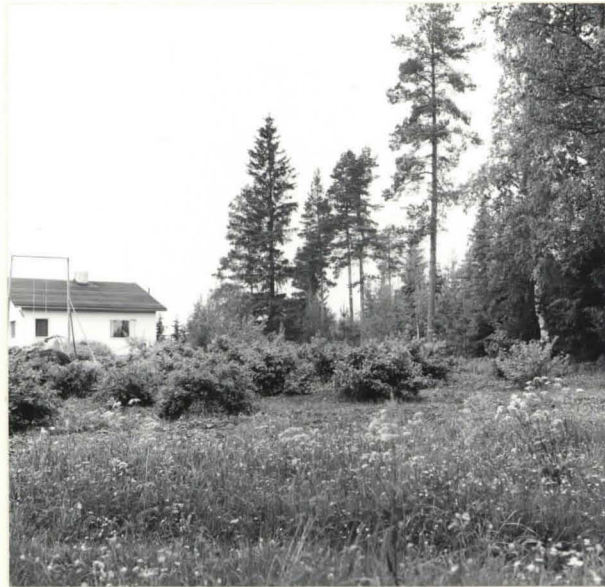
f. 33 932