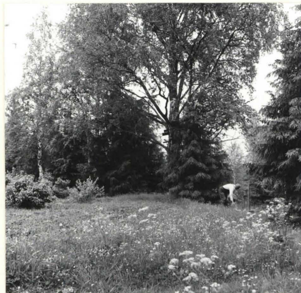
f. 33 933

Mv. Palmu osoittaa erään esineen löytöpaikkaa.