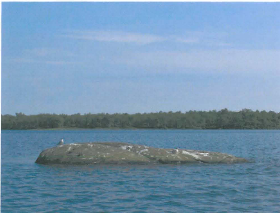
Kuva 2. Sitakallio.

Sitakallio sijaitsee Iijärven eteläpäässä, Vaijoen laskukohdasta ja Järvelästä n. 1,5 km koilliseen Vyeppenjargân lounaispuolella (kartta 1). Sitakallio on noin 40 cm veden yläpuolelle kohoava, noin 3,5 x 2 metrin kokoinen kallio (kuva 2). Kivi on kirjallisten lähteiden perusteella toiminut kalaseitana.