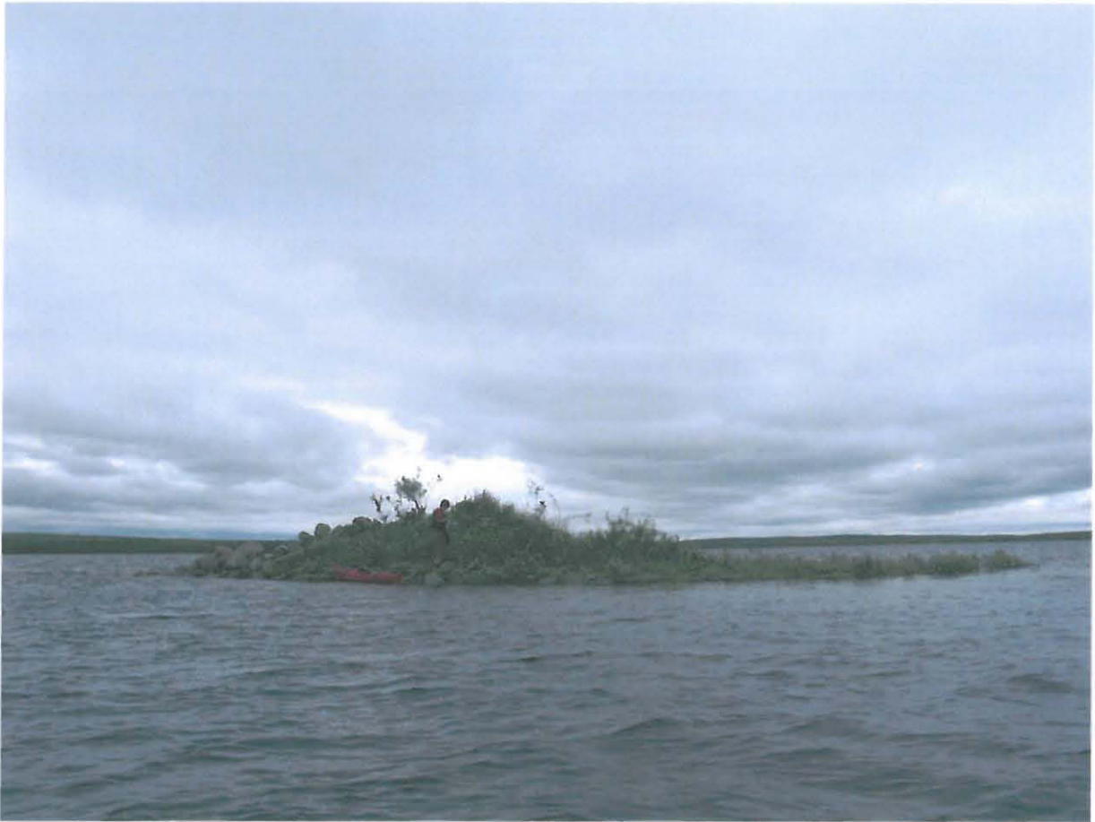
Kuva 3. Seitasaari kuvattuna etelästä.

Kirj. 1932 Paulaharju, E. Itkonen 1933, T.I. Itkonen 1946