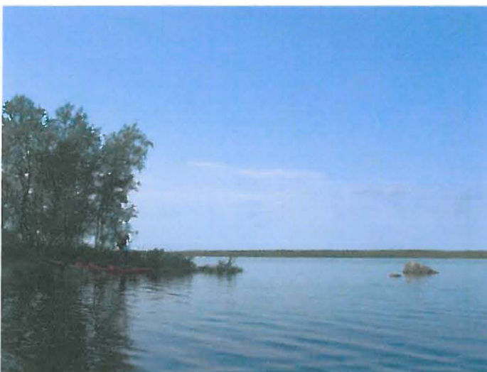
Kuva 1. Kivi Annansaaren pohjoispäässä.